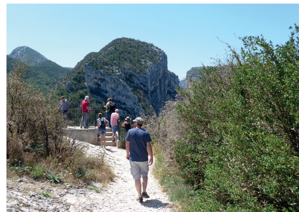
D - Vue en arrivant sur le bvédère actuel le 13 juillet 2018