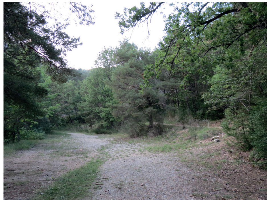
C - Vue depuis le futur parking vers l'entrée le 20 septembre 2018