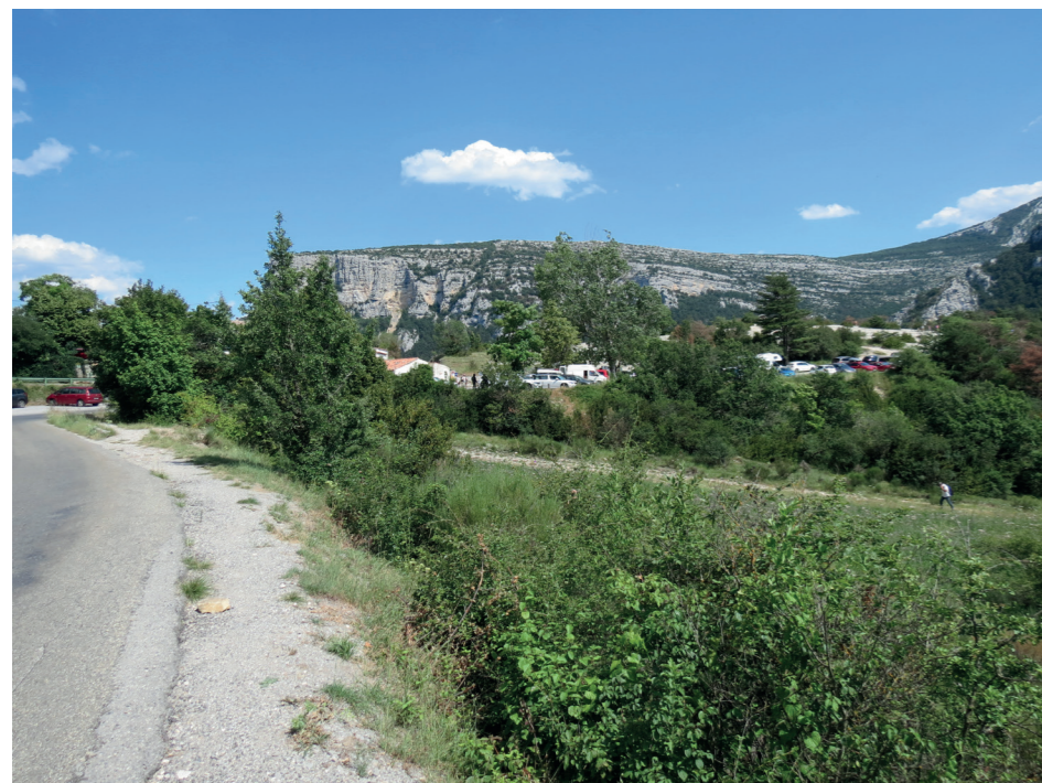
B - Vue depuis la RD en arrivant sur le site le 13 juillet 2018