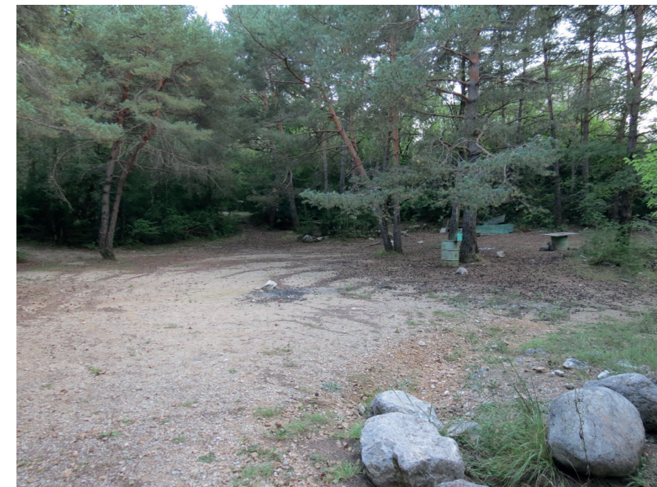
D - Vue dans le futur parking vers la future aire de pique-nique le 20 septembre 2018