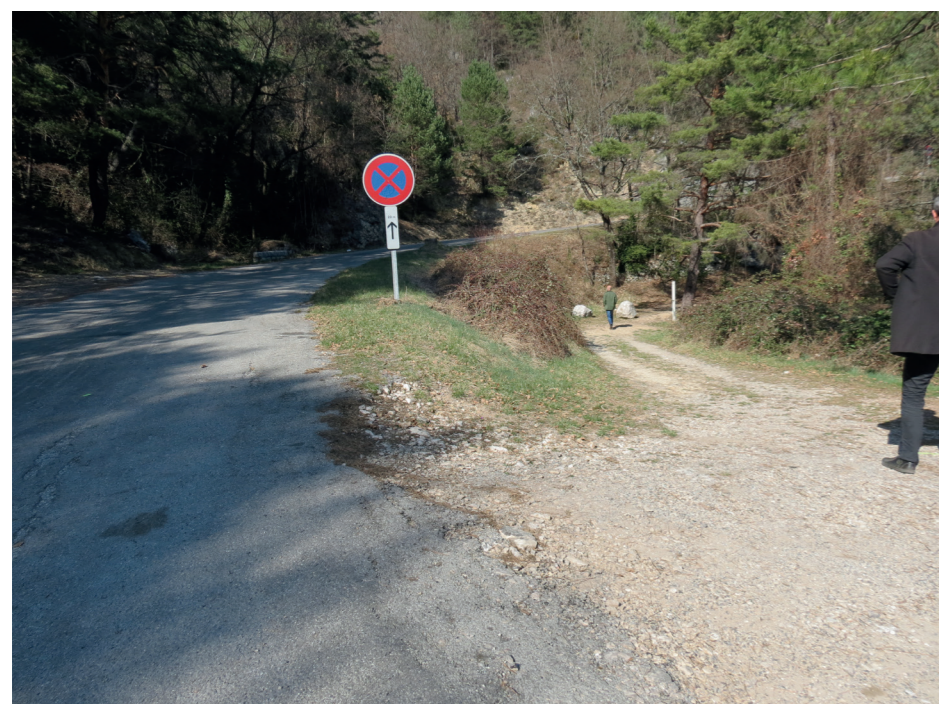
B - Vue depuis l'entrée (futur giratoire) le 28 mars 2019