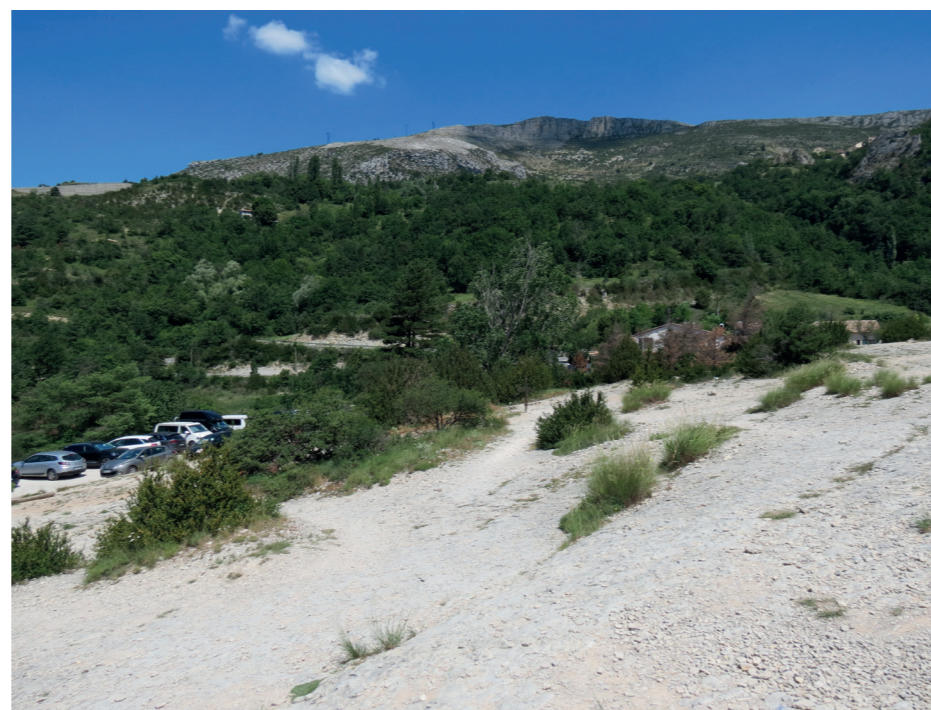
C - Vue en revenant du belvédère en allant vers le parking sauvage actuel le 13 juillet 2018