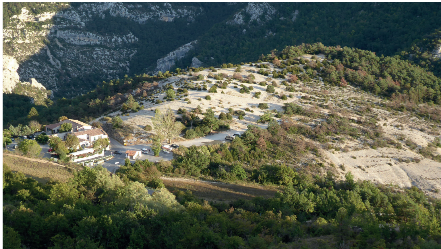
A - Vue depuis la RD desservant Rougon en descendant le 01 octobre 2018