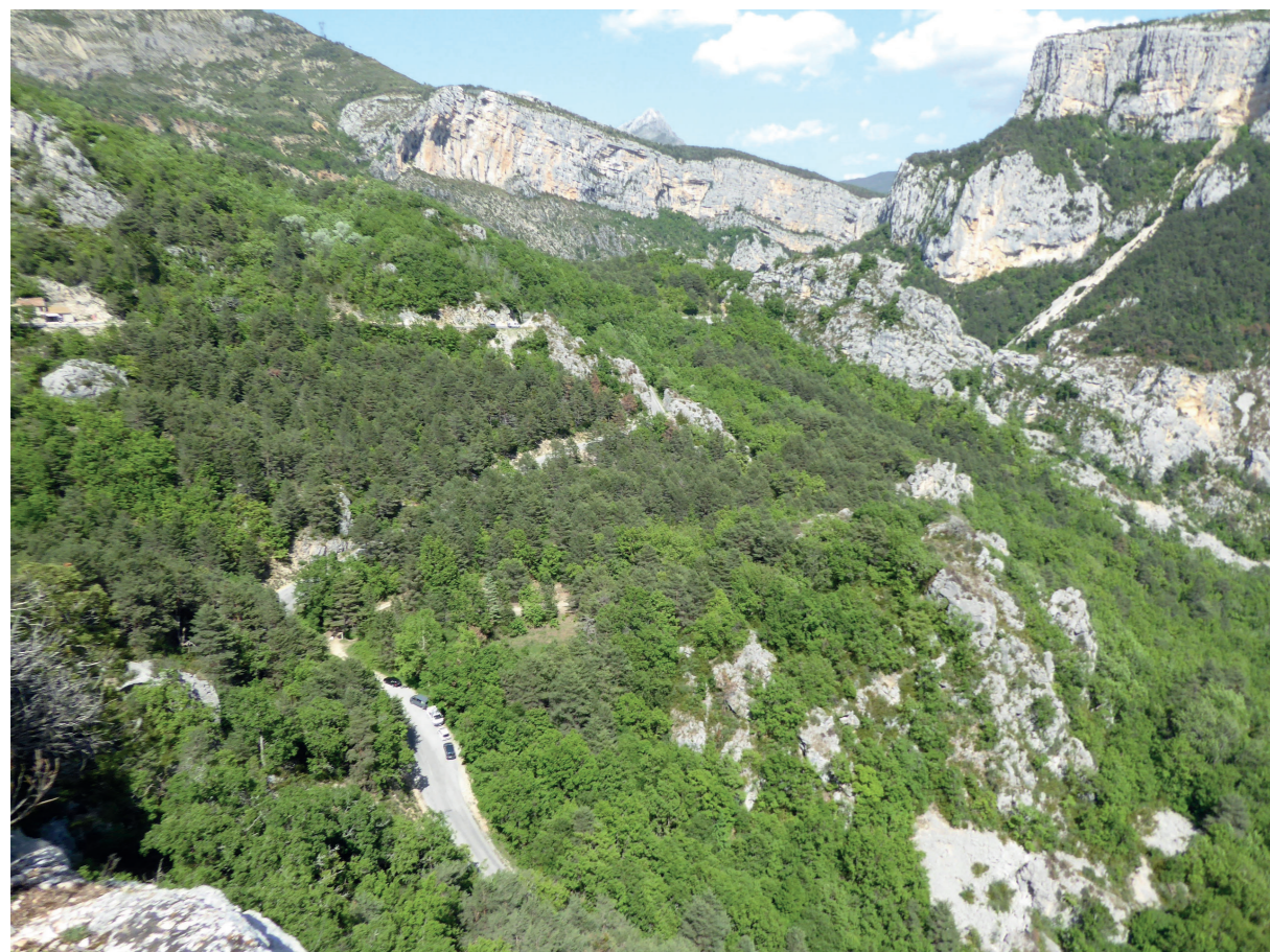
A - Vue depuis le belvédère du point Sublime le 25 mai 2018