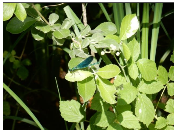
Agrion vierge (mâle)