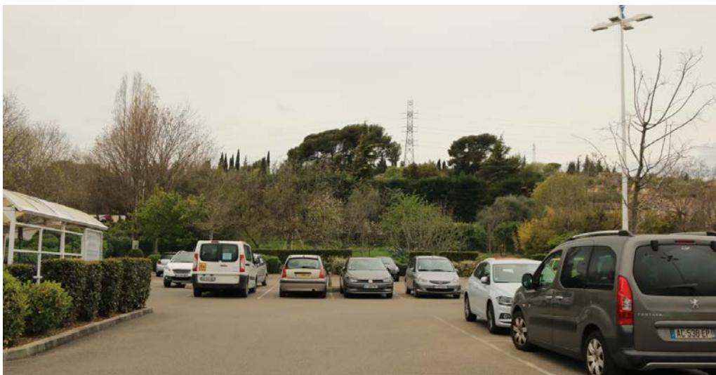
Date de prise de vue : 12 avril 2019