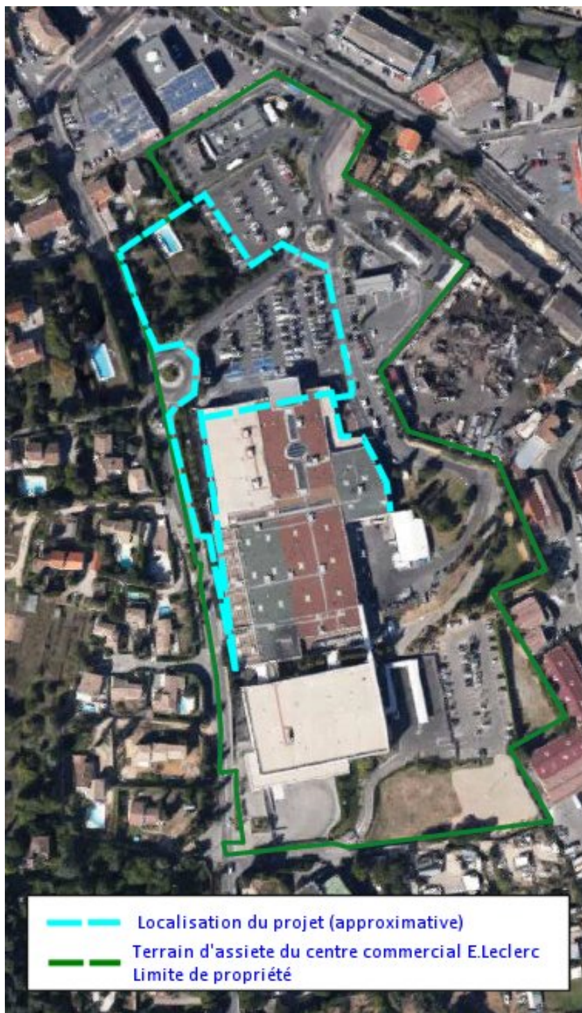
Photo aérienne du site

Fond de plan : dossier SARL MAZZARESE ARCHITECTES