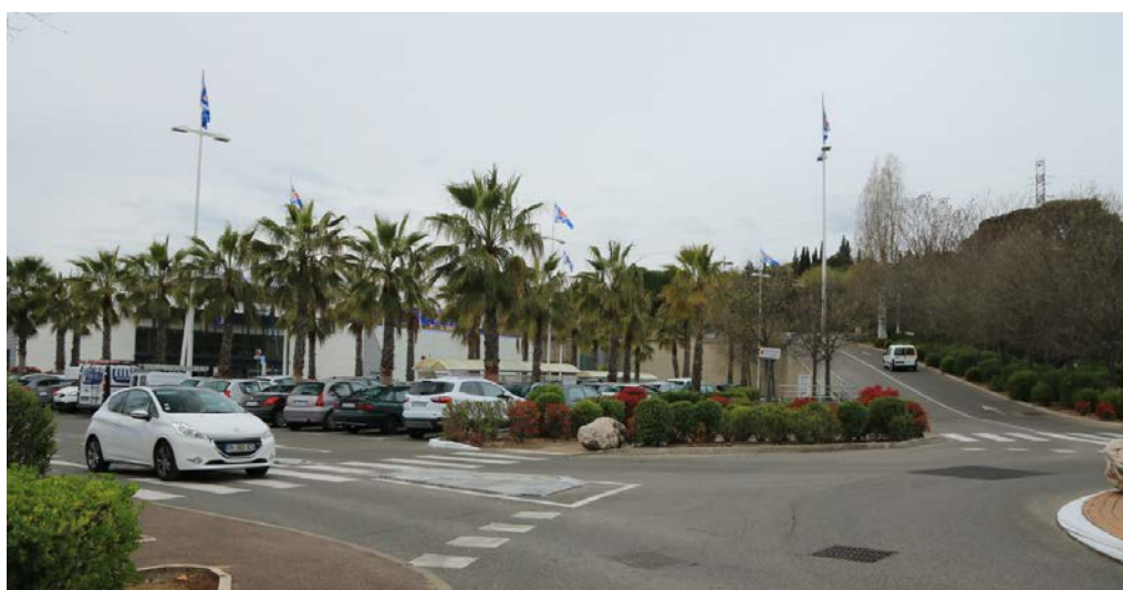
Date de prise de vue : 12 avril 2019