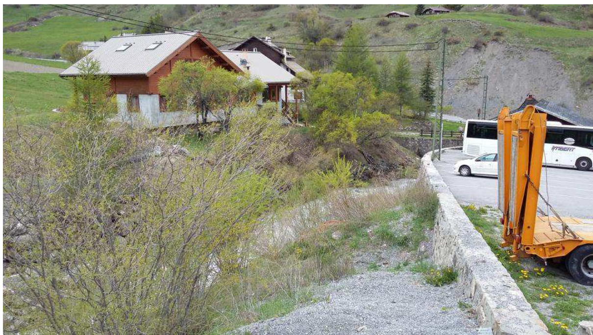
Tronçon aval (tranche 1 travaux) _ vue vers aval, vers confluence Chagne