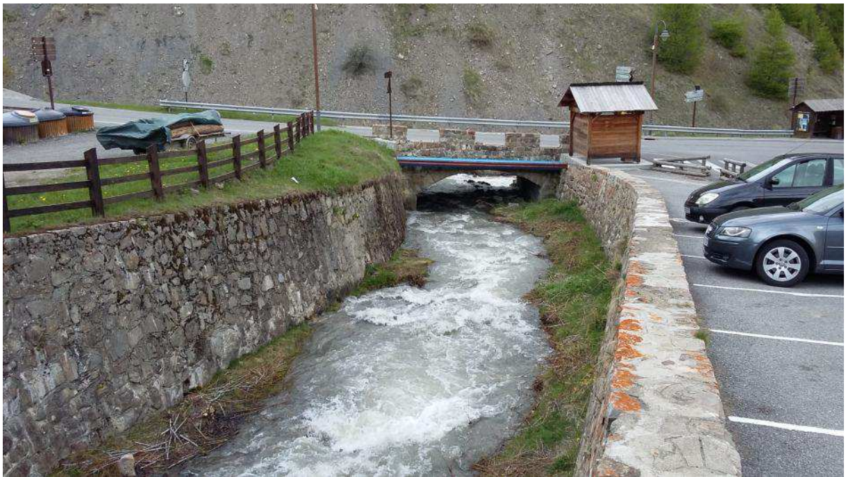
Tronçon aval (tranche 1 travaux) _ vue vers aval : pont de la RD902 à reprendre avec entonnements