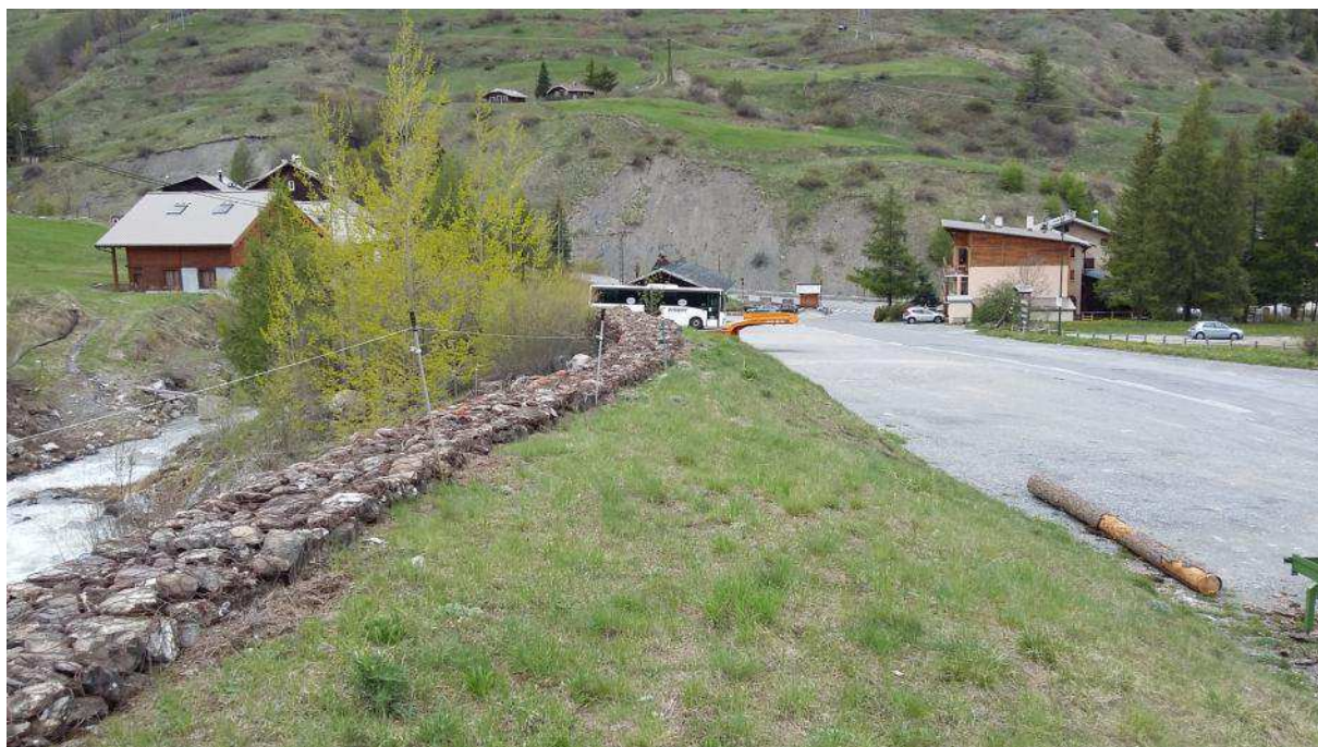
Tronçon intermédiaire aval (vue vers aval) – tranche trois de travaux : partie aval de la digue de protection avec gabions en crête, le long du parking