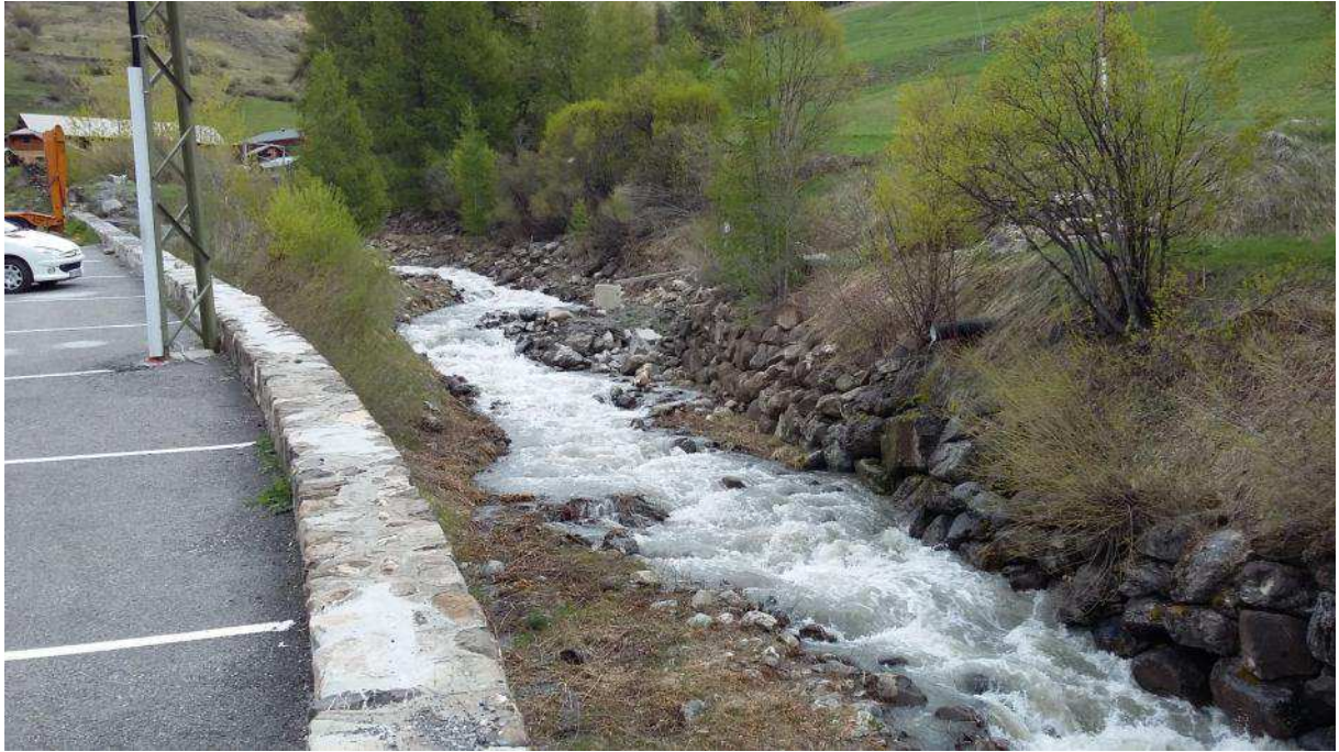
Tronçon aval (tranche 1 travaux) _ vue vers amont