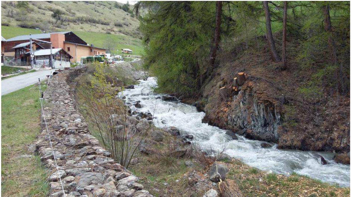
Tronçon amont (deuxième tranche travaux) : vue vers amont de la digue rive droite surmontée de gabions (au droit de la déchetterie)