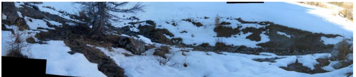
Photographie 2 - Zone d'implantation du futur busage (assemblage panoramique RTM)