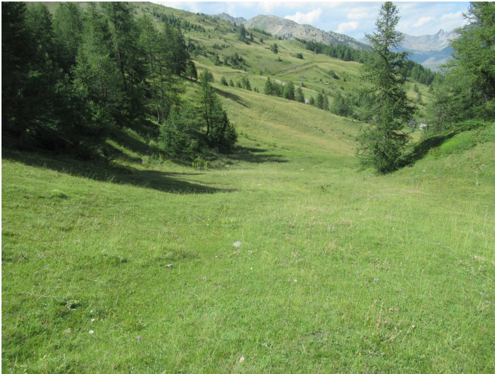
Photographie 1 - Secteur aval de la piste