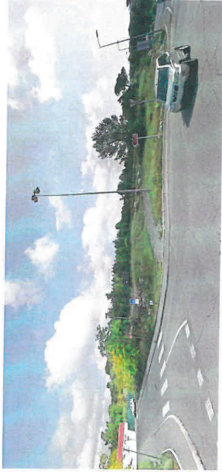
Vue 1 (mai 2018)