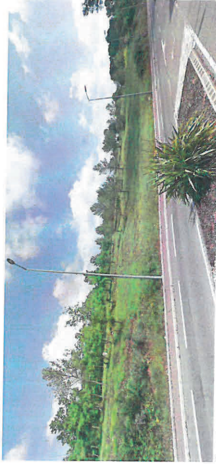
Vue 2 (mai 2018)