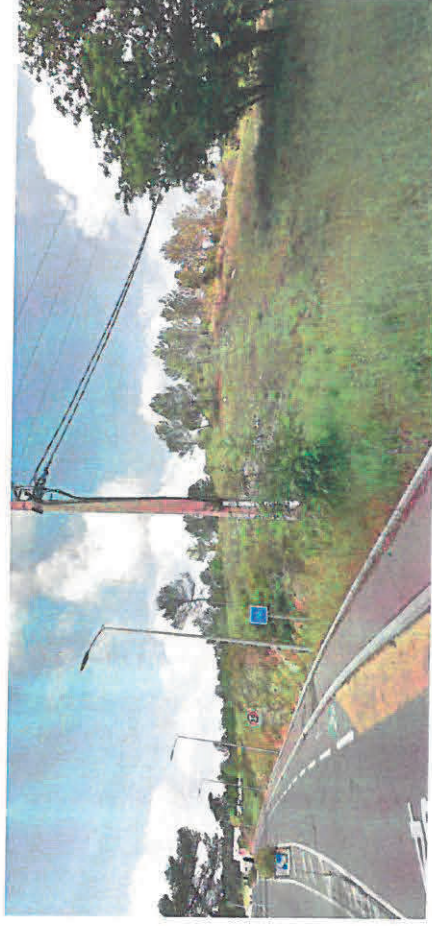
Vue 3 (mai 2018)