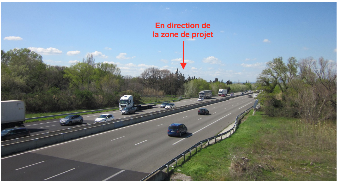
5/ Vue depuis le pont au-dessus de l'A7 : la zone de projet est masquée par la végétation arborée