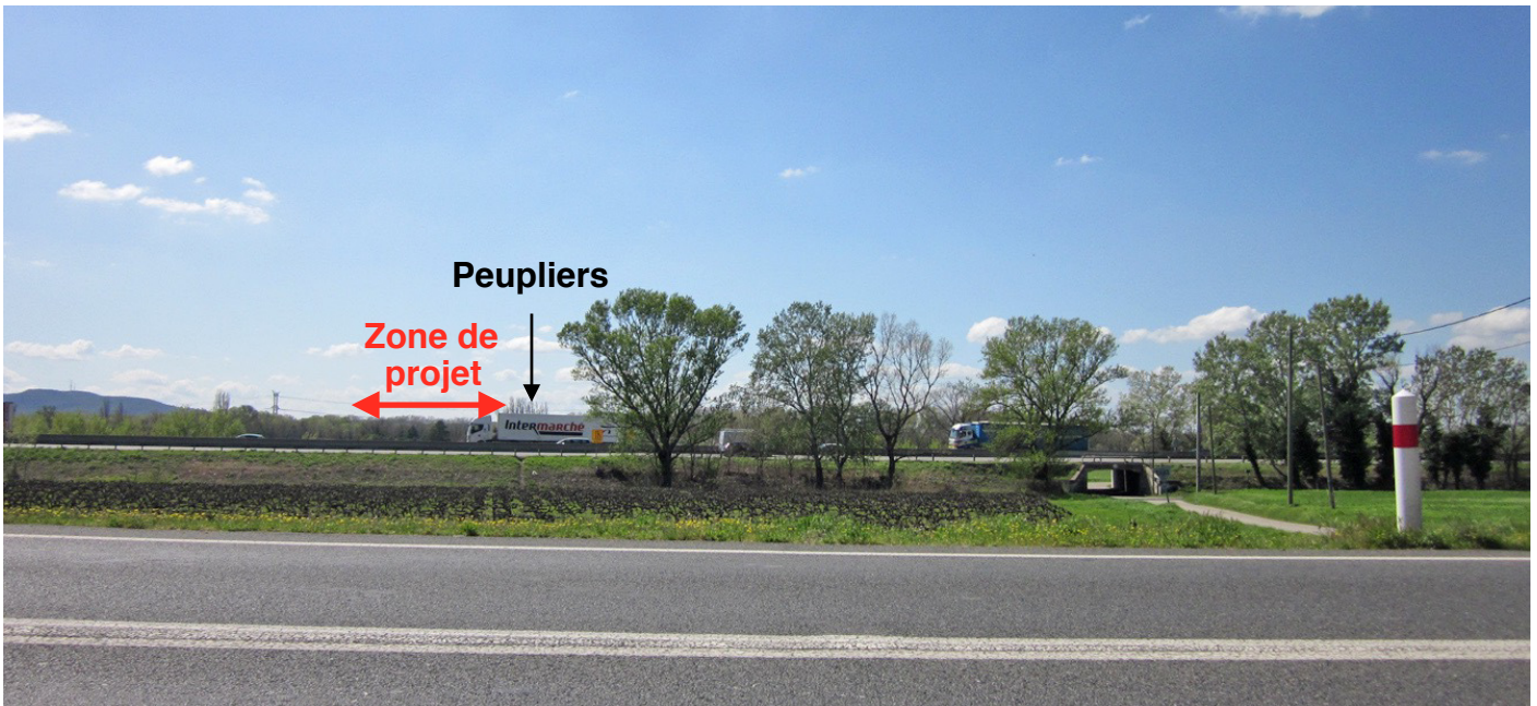
4/ Vue depuis la RN7 : l'autoroute A7 s'interpose dans la perception sur la zone de projet qui se repère grâce à l'alignement de peupliers bordant son côté Nord.