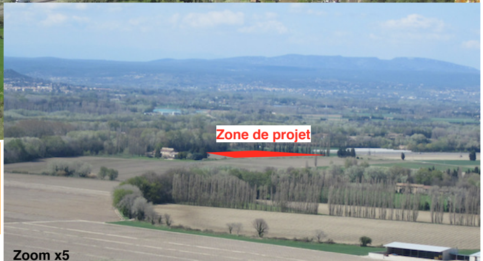
8/ Vue depuis la Cité de Mornas (site inscrit) : une vue panoramique s'ouvre sur la plaine, avec une perception au loin de la zone de projet