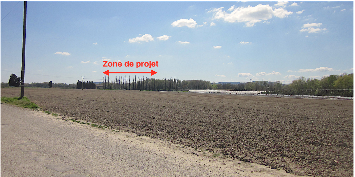
2/ Vue hivernale depuis le chemin en contrebas de l'autoroute, au Nord de la zone de projet : la zone de projet apparaît à l'arrière d'un alignement de peupliers qui filtre la perception. Des serres tunnels occupent une partie de la plaine agricole