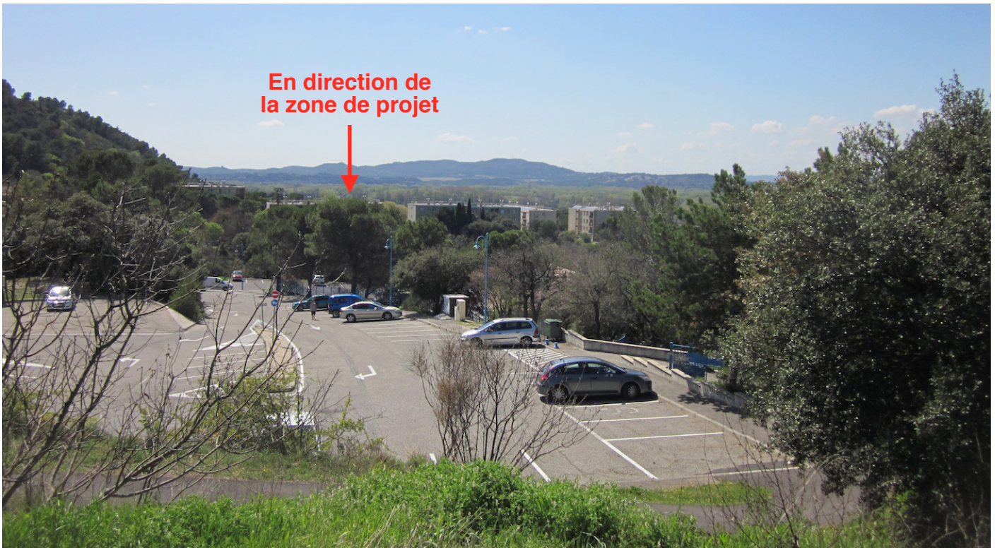
7/ Vue depuis la Cité des Grillons, aux abords du site inscrit : la distance et les obstacles visuels (bâti et végétation arborée) empêche toute perception sur la zone de projet