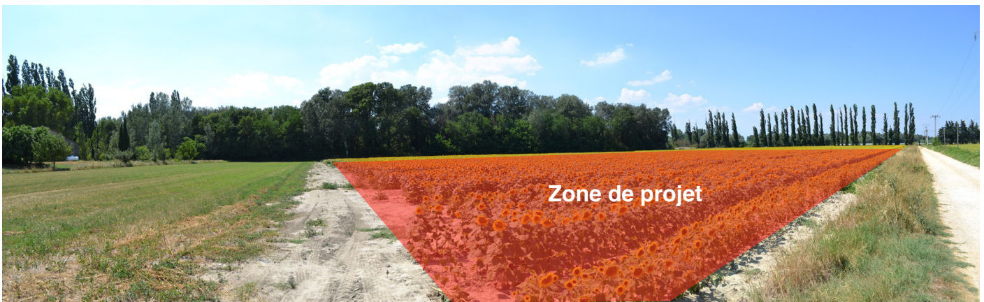
1/ Vue depuis le sud du chemin longeant la parcelle du projet : la vue est ouverte sur la zone du projet, bien délimitée à l'Ouest et au Nord par des alignements d'arbres