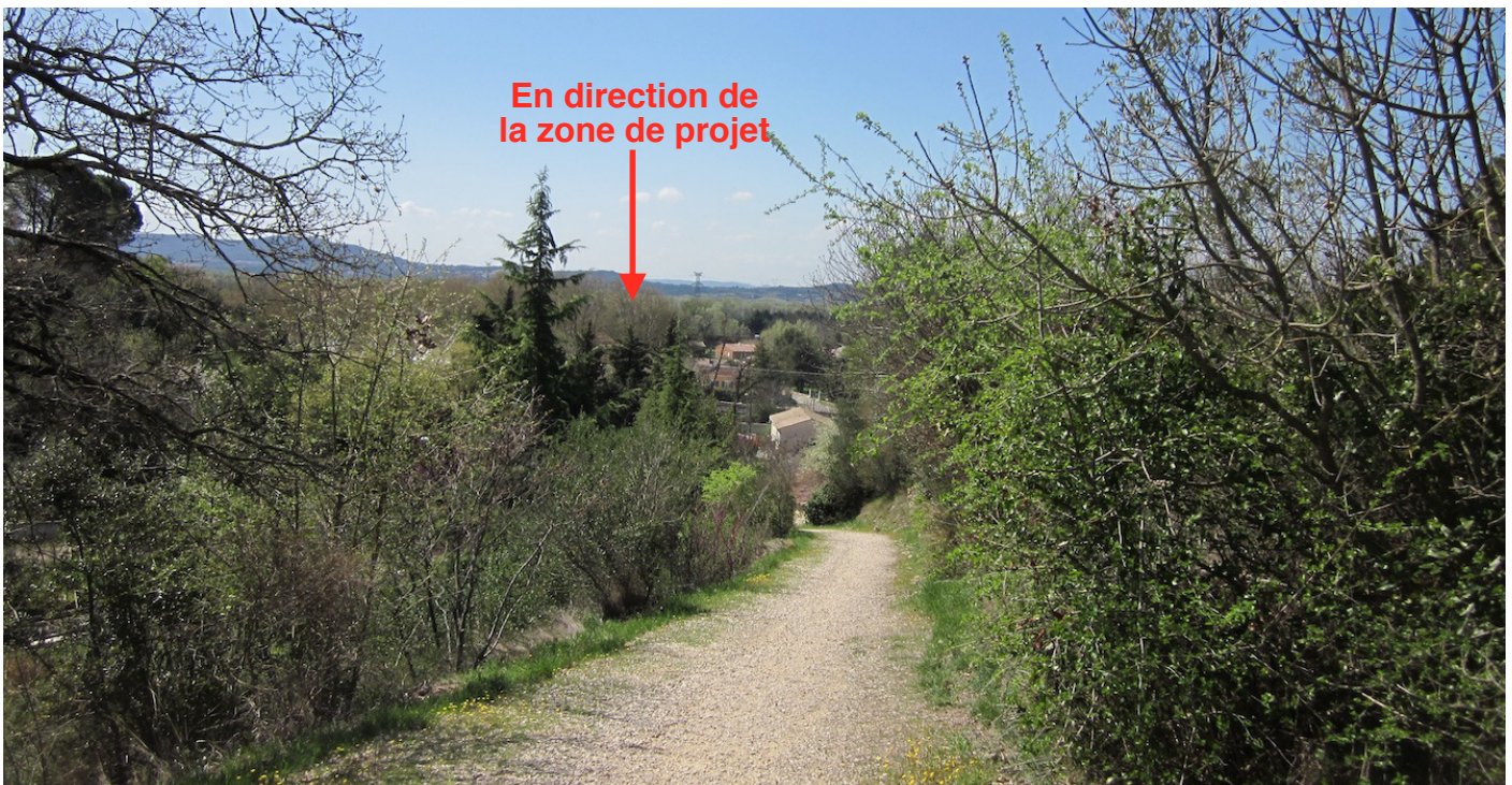
6/ Vue depuis les abords des ruines du château de Mondragon (site inscrit) : la végétation arborée masque la zone de projet