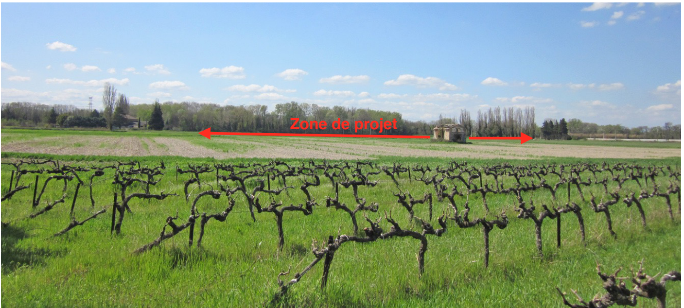
3/ Vue depuis le chemin en contrebas de l'autoroute, au droit de la zone de projet : la vue est ouverte sur les parcelles