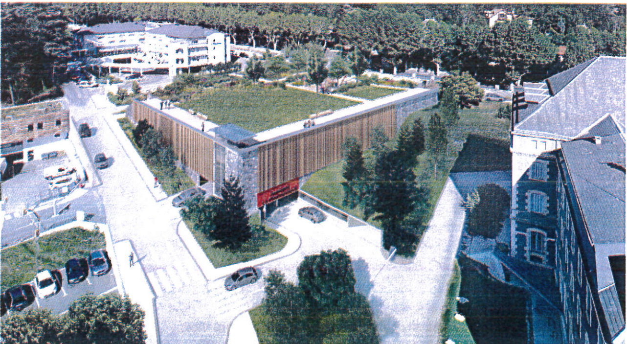
Insertion du projet dans son environnement

Le bâtiment sera raccordé aux réseaux existants rue Ernest Cézanne.