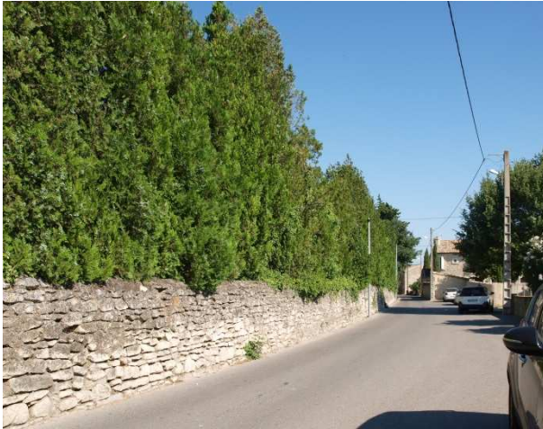
Vue position 4 Vue sur le mur de pierres et la haie arborée à préserver en limite Est du site – Environnement urbain villageois