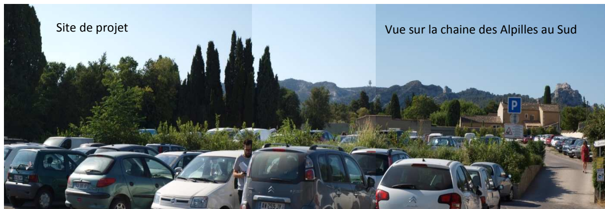
Parking Ouest existant