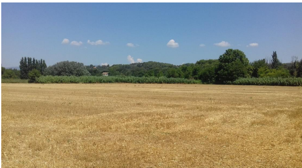
Figure 5 : vue Nord depuis l'extrémité Sud du terrain de projet