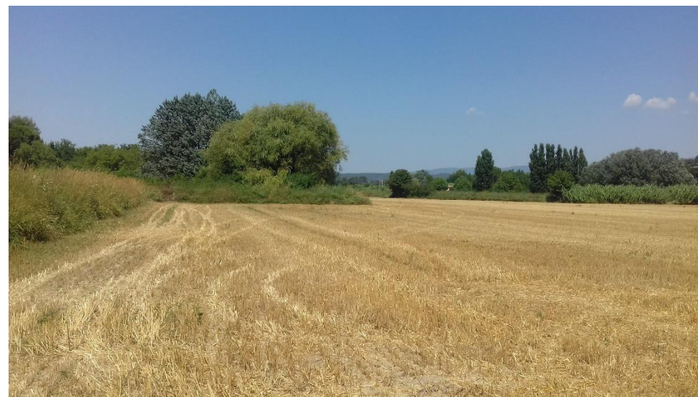
Figure 6 : Vue Ouest depuis l'extrémité Sud de la parcelle, nous pouvons observer les limites de la parcelle 95