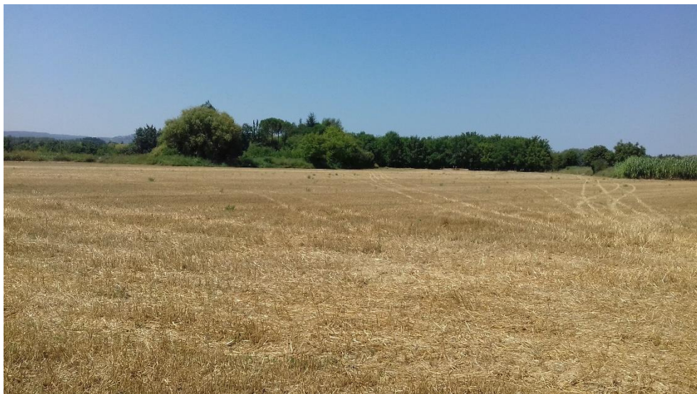
Figure 3 : Vue Sud à l'entrée principale de la parcelle