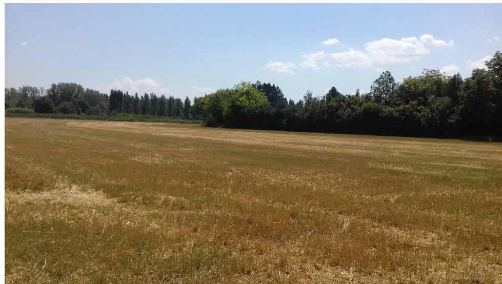
Figure 12 : Vue Sud-Est sur la forêt qui correspond à la limite des parcelles 87 et 88