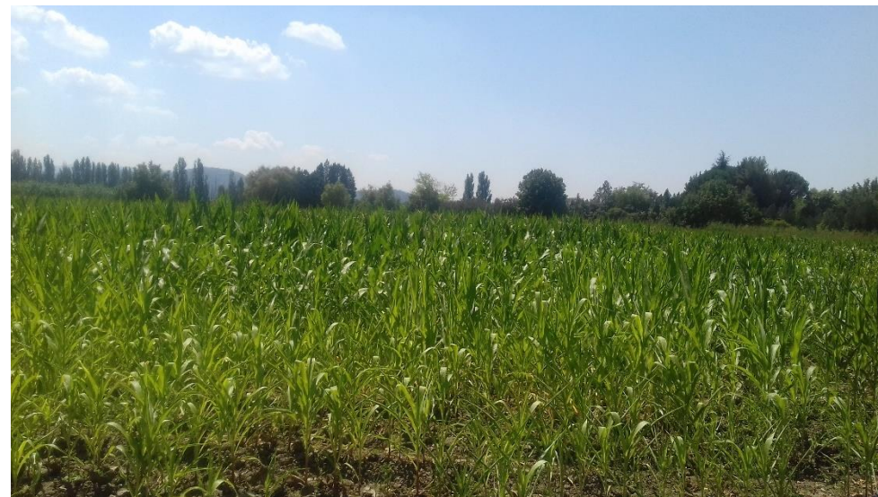
Figure 14 : Vue Sud depuis l'extrémité Nord-Ouest du terrain de projet, le champ est actuellement en culture mais il sera prêt pour les travaux une fois la récolte de l'année 2018 réalisée.