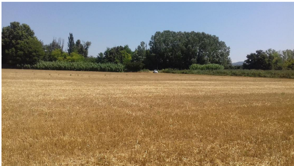
Figure 9 : Vue Nord depuis la limite entre les parcelles 89 et 92