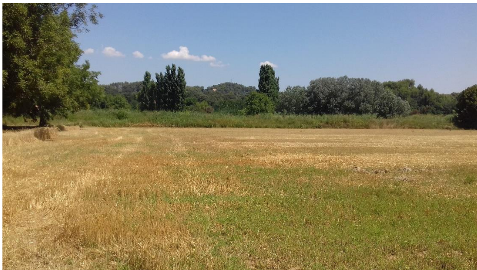
Figure 11 : Vue Nord depuis l'extrémité Sud-Ouest du terrain de projet.