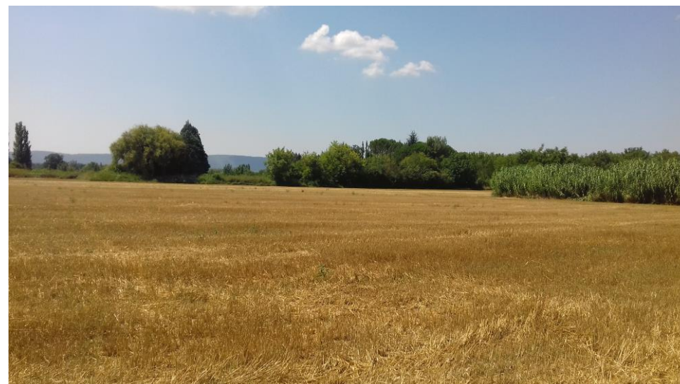
Figure 16 : Vue Sud-Ouest depuis le point Nord aux limites des parcelles 92 et 95