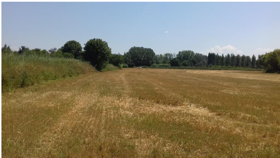
Figure 13 : Vue Est depuis le milieu du terrain de projet. Nous pouvons observer les limites de la parcelle 99 (fond de la photo)