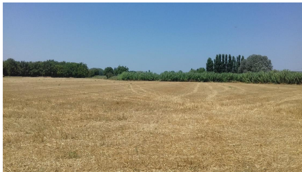
Figure 4 : Vue Ouest à l'entrée de la parcelle