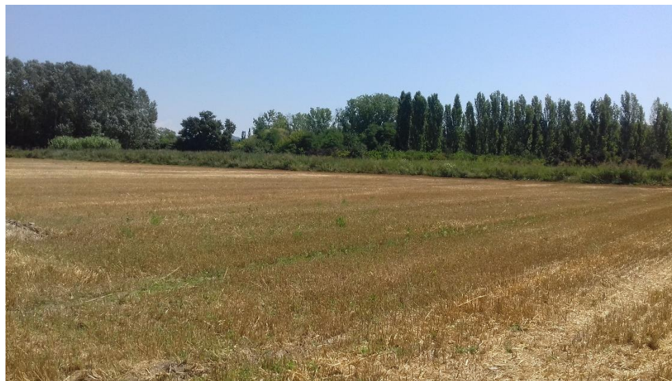
Figure 7 : Vue Nord-Est depuis l'extrémité Sud du terrain du projet