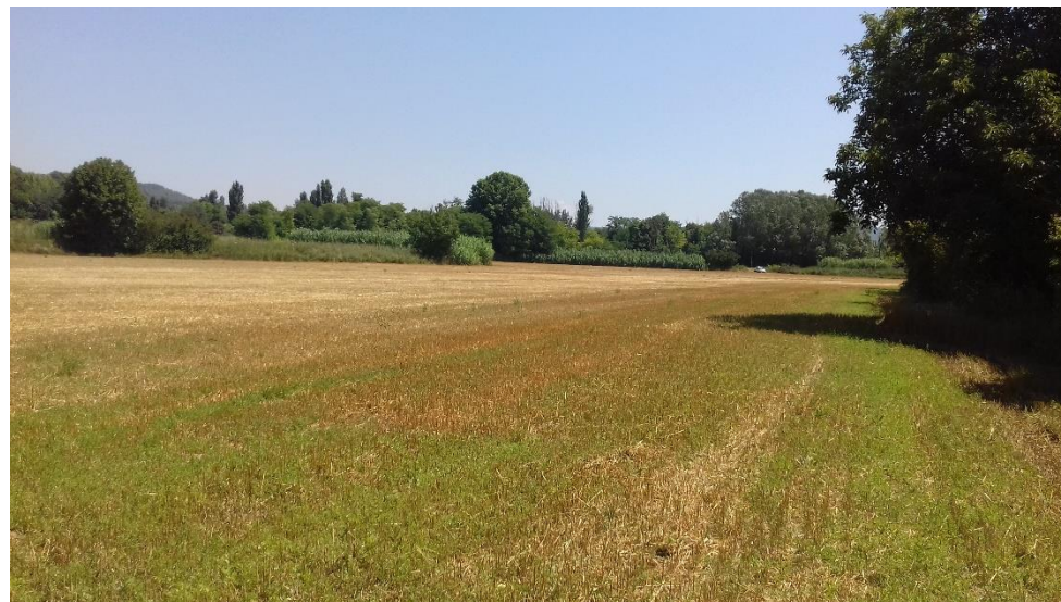
Figure 10 : Vue Est depuis l'extrémité Sud-Ouest du terrain de projet