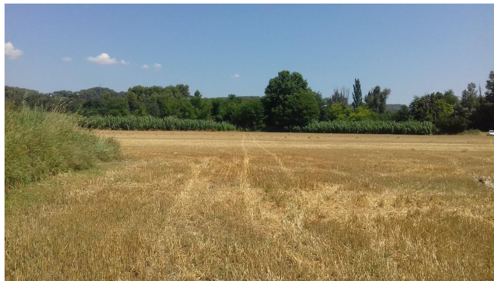
Figure 8 : vue Nord depuis la limite entre les parcelles 92 et 95