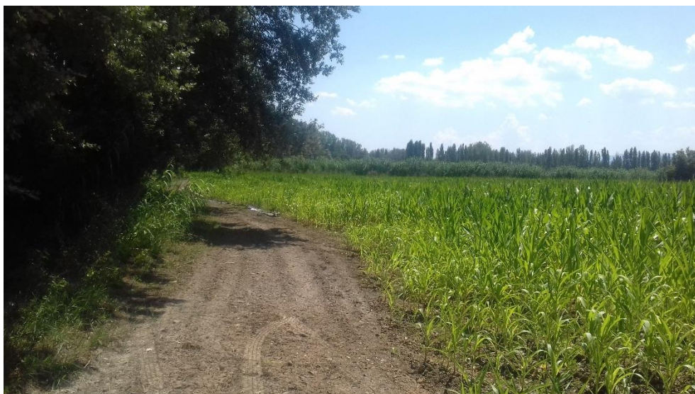
Figure 15 : Vue Est depuis l'extrémité Nord-Ouest du terrain de projet, le champ est actuellement en culture mais il sera prêt pour les travaux une fois la récolte de l'année 2018 réalisée.