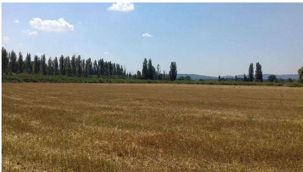
Figure 17 : Vue Sud depuis les bordures des parcelles 92 et 95