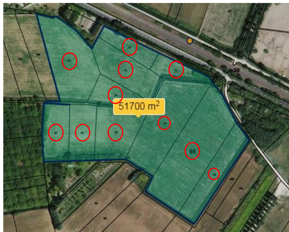
Figure 2 : Plan cadastral des parcelles concernées par le projet serre n°1

Section F n° : 77-78-79-80-81-87-88-89-92-95-96-99