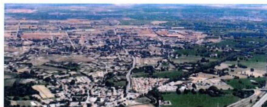
Vue aérienne de Pont-de-Crau, vers l'est