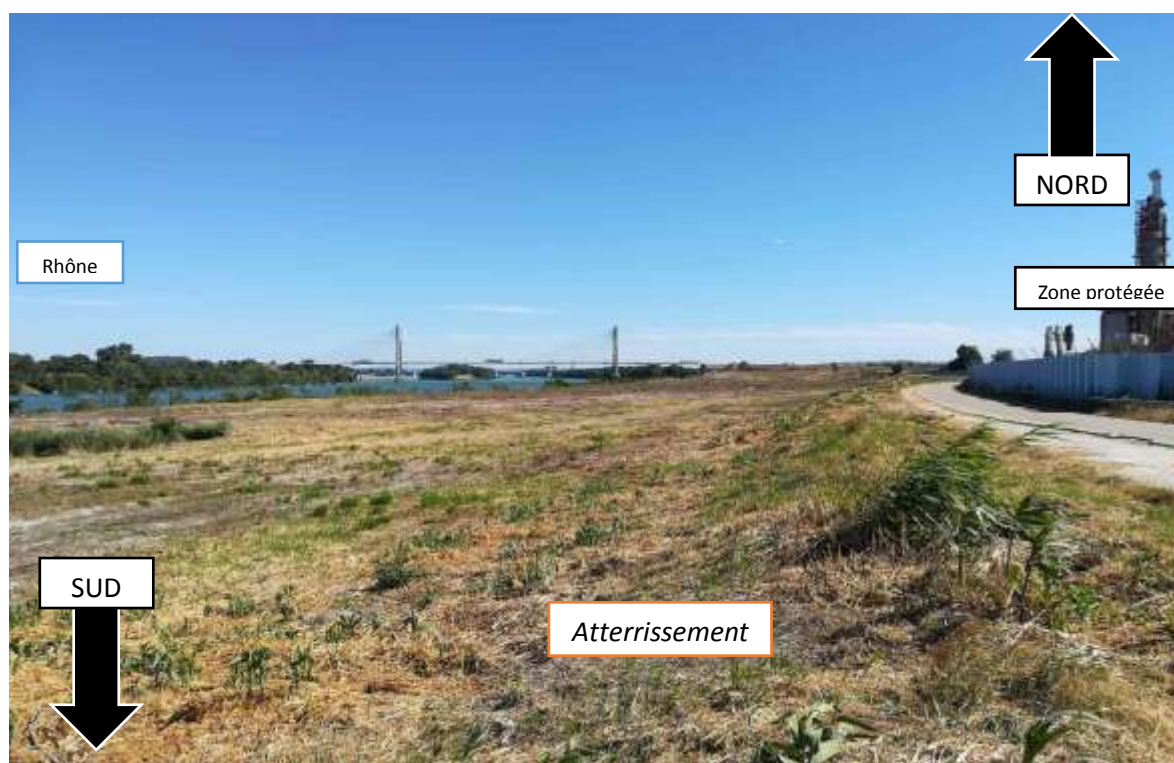
Légende : vue sur l'atterrissement ayant fait l'objet d'une évaluation environnementale - travaux de défrichement achevés en juillet 2018. Extraction des matériaux prévue en début d'année 2019