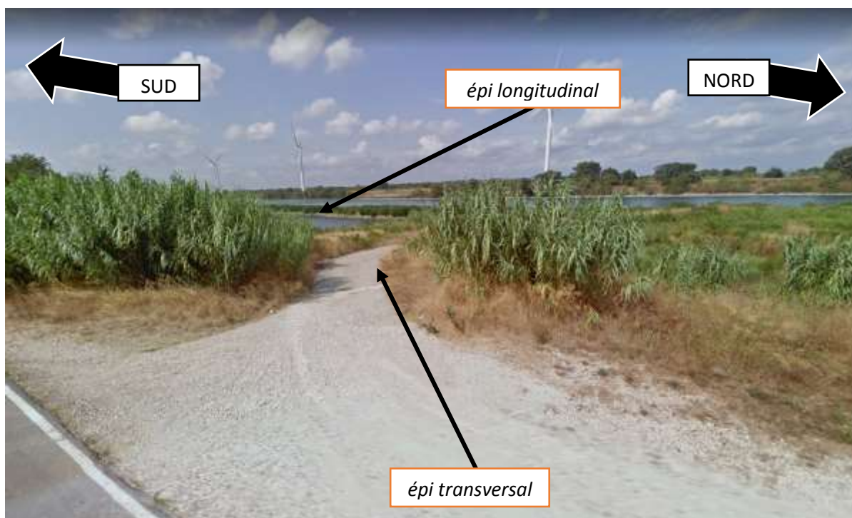
Légende : vue sur l'épi transversal au premier plan et épi transversal en second plan