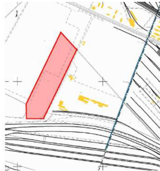
PLAN CADASTRAL - Section B Parcelle 2261 - Superficie = 63 775 m 2