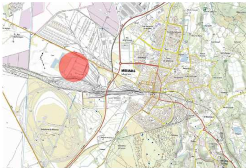
CARTE IGN - 1/25 000