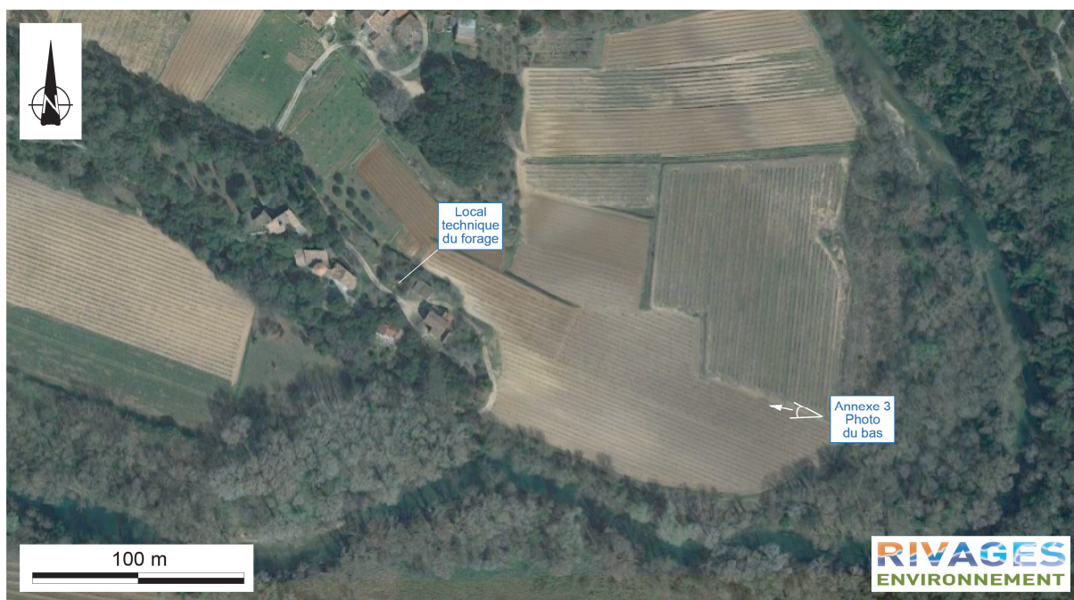
Situation du projet dans son environnement proche (photo aérienne du haut) et immédiat (photo aérienne du bas)