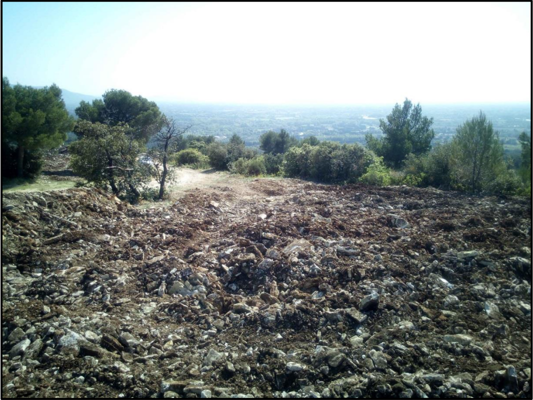
PHOTO D - 04/2018 – Vue de l'emplacement prévisionnel du forage depuis le nord-ouest :