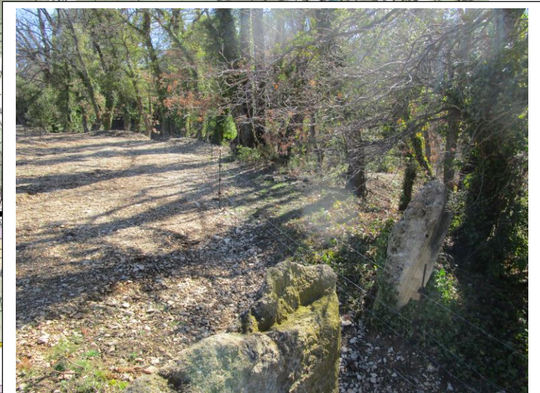
Vue vers le Sud (bois) – photo du 13.03.2018