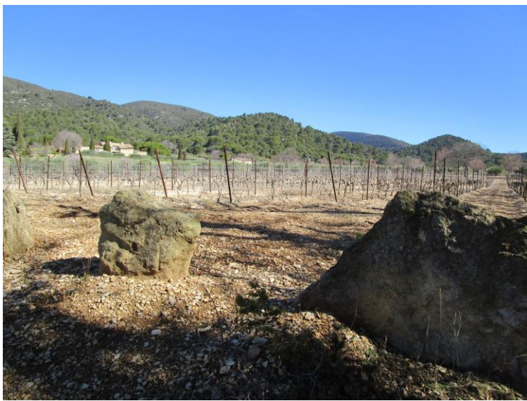
Vue vers le Nord (vignes et Grand Luberon) – photo du 13.03.2018