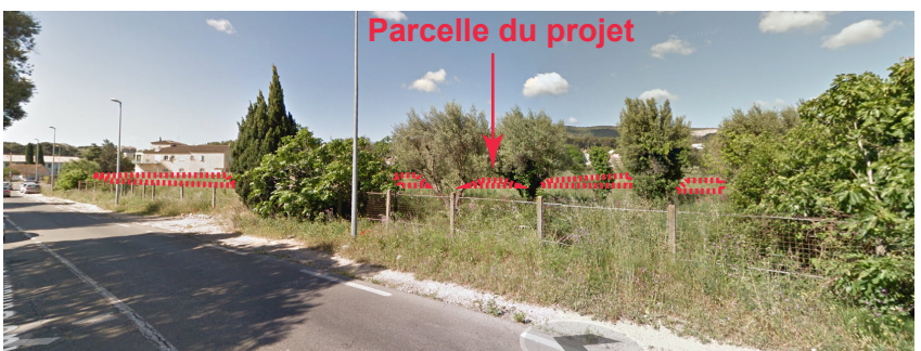
Vue 1 - Vue depuis l'avenue Bodin et vue 9 - depuis l'avenue Dulac sur le site, mai 2015