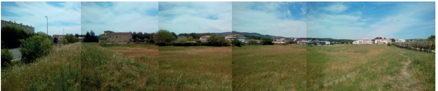
Vue 8 - Vue sur la prairie et le bassin de rétention en partie sud du site, 06/05/2016