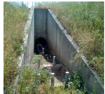
Vue 6 - mur en pierre, Vue 5 - fossé à sec, Vue 7 - Exutoire en limite sud, 06/05/2016 - Novacert