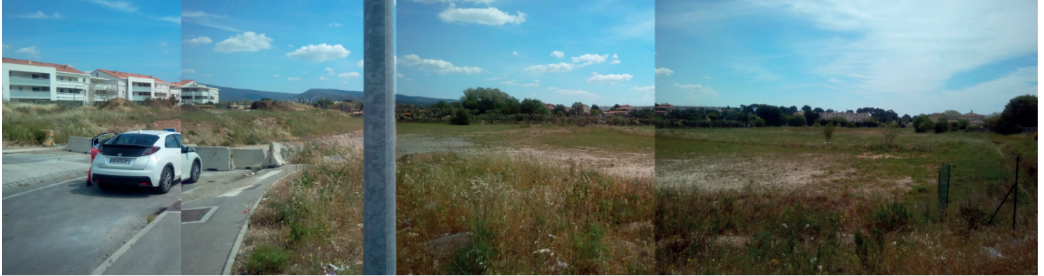
Vue 3 - Vue depuis le rond sur des terres régulièrement roulées et modifiées, 06/05/2016 - Novacert