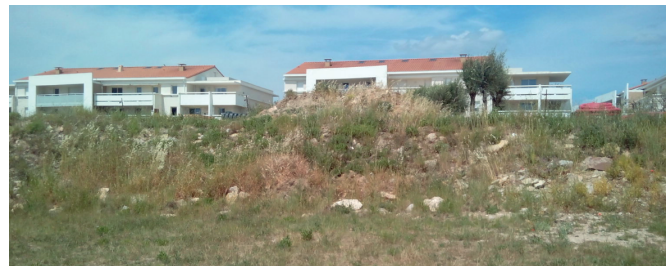
Vue 2 - Vue de la voie pompier et vue 4 - vue des logements collectifs au nord et du talus, 06/05/2016 - Novacert