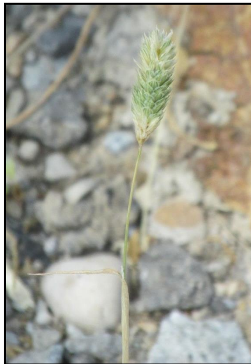
Petit alpiste ( Phalaris minor )

Le long des berges de La Cagne, juste un individu de Petit Alpiste ( Phalaris minor ) a été rencontré mais il n'a aucun statut de protection.