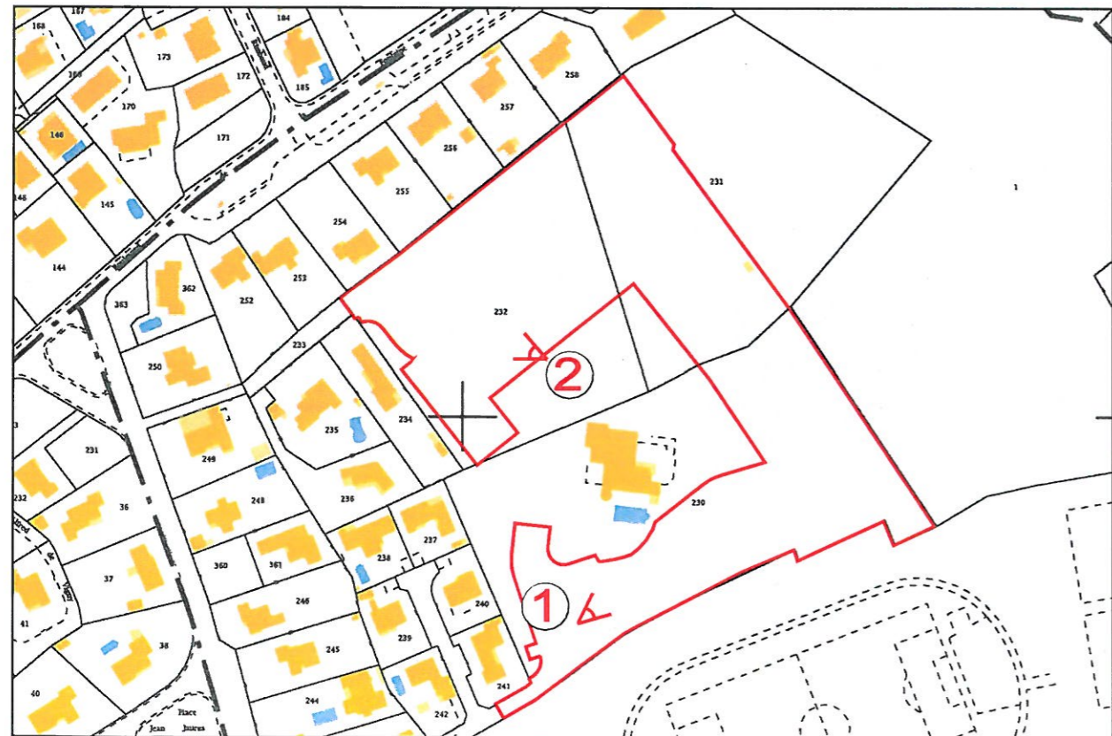
Localisation des clichés