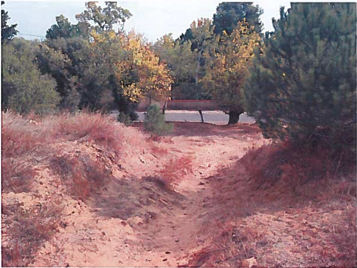
Prise de vue n°6