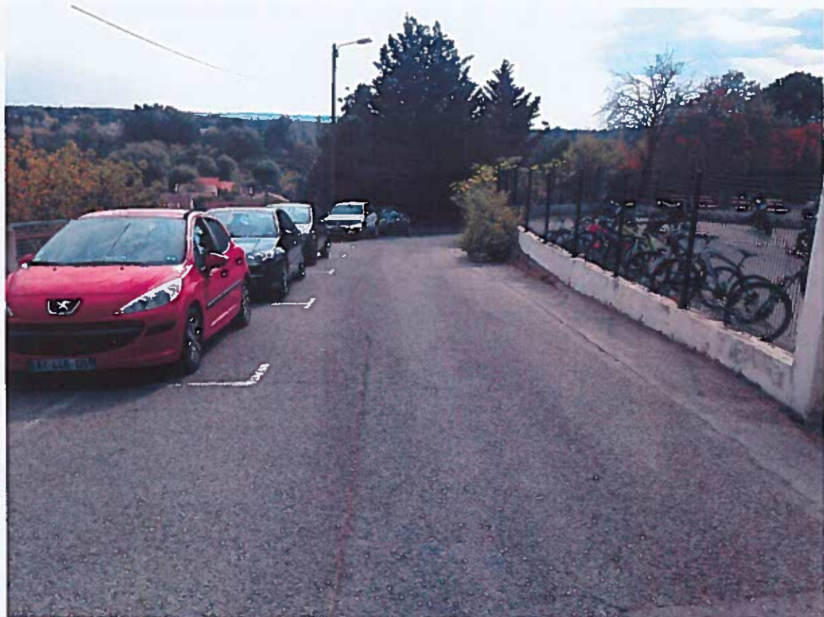
Prise de vue n°3