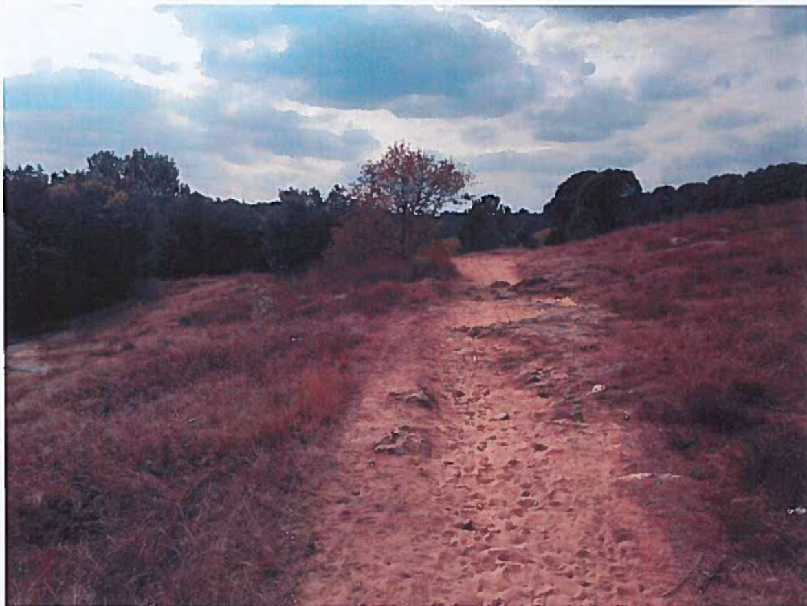
Prise de vue n°5