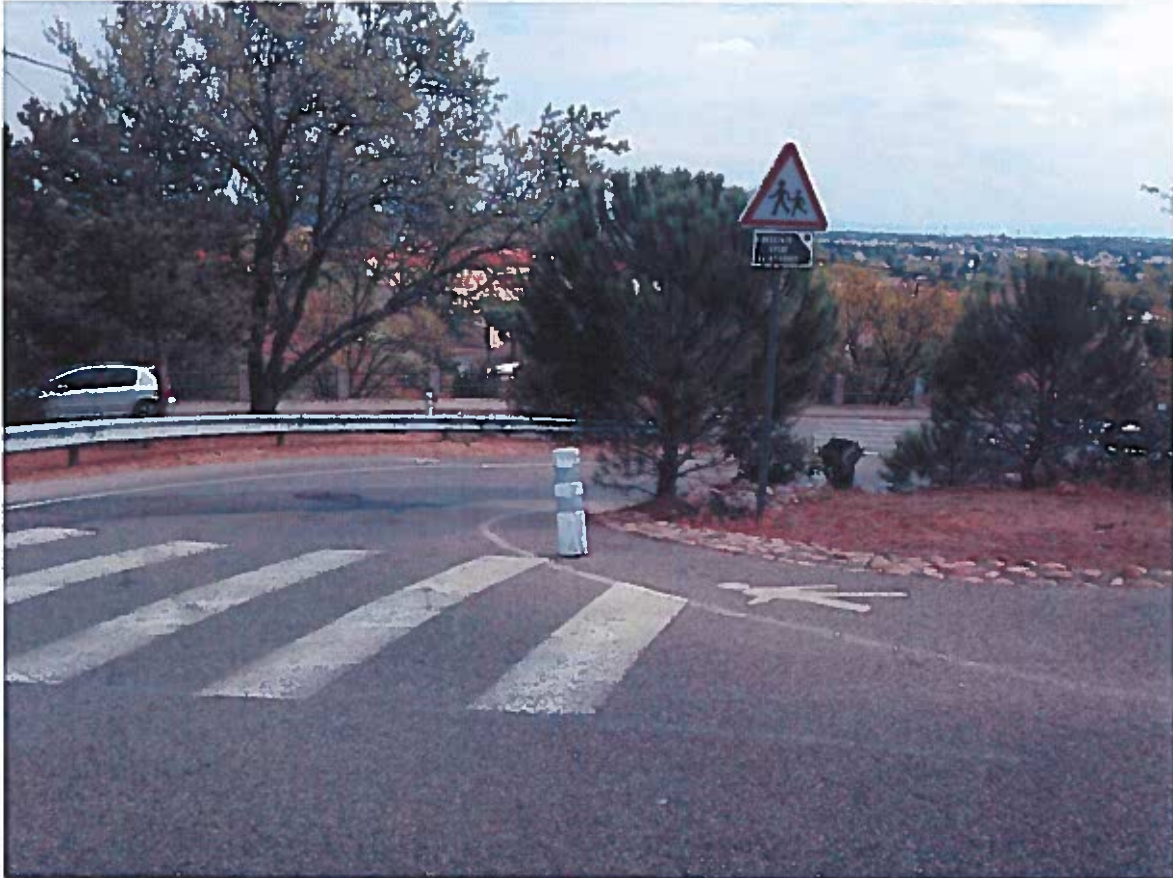
Prise de vue n°1