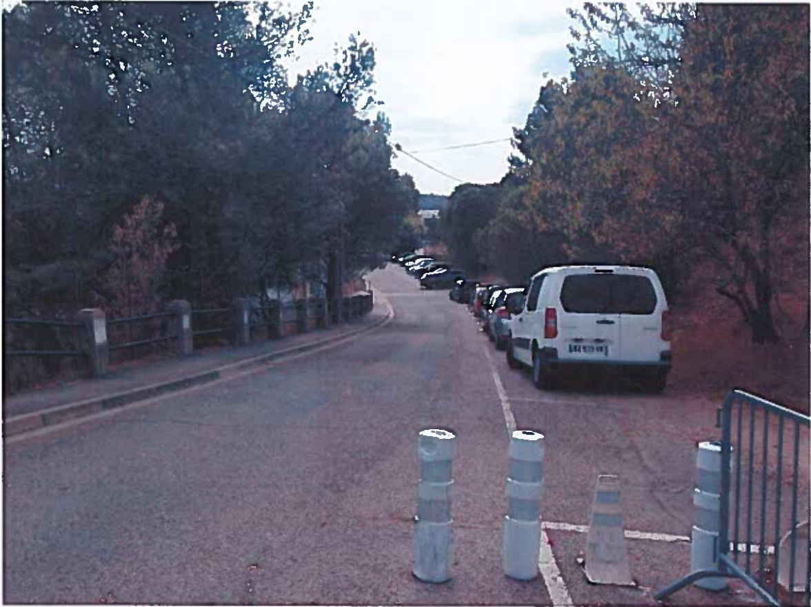
Prise de vue n°2