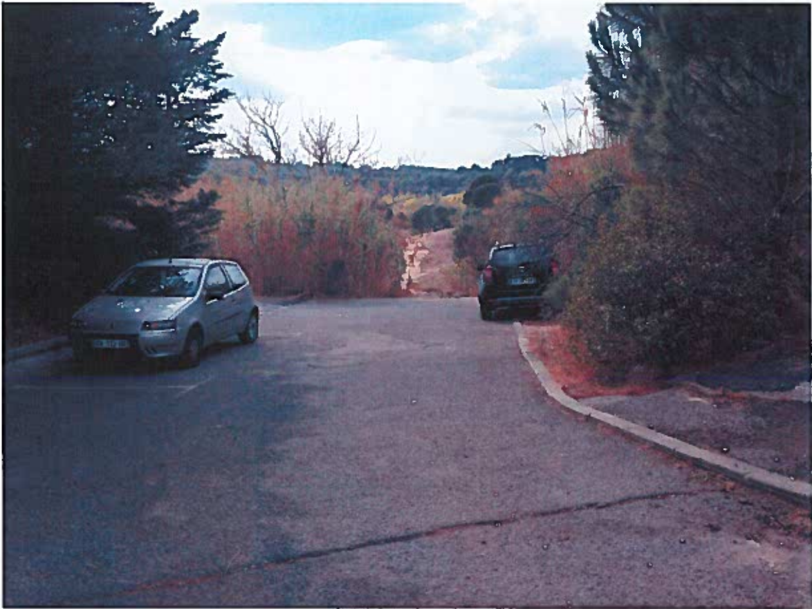
Prise de vue n°4