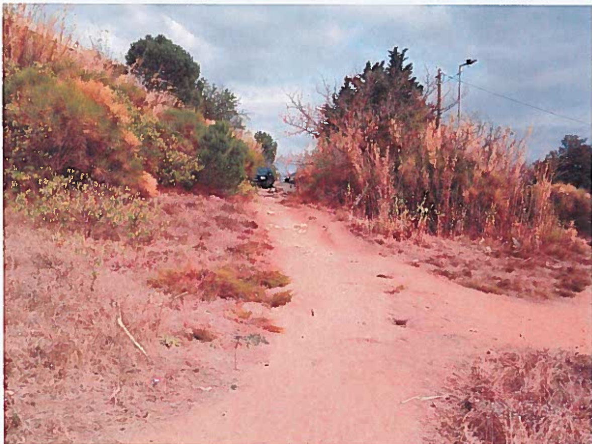
Prise de vue n°7