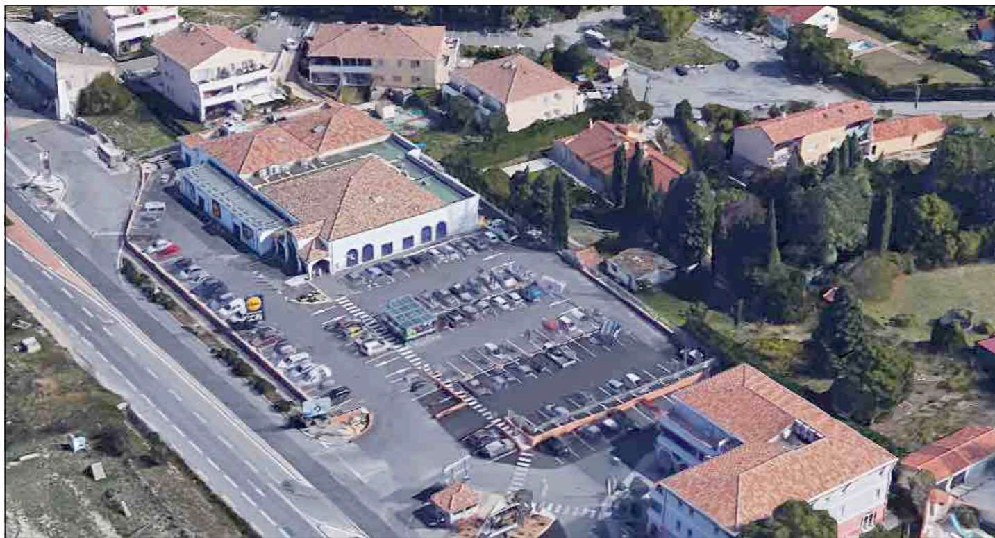
Vue 01 Photo lointaine (Août 2017)