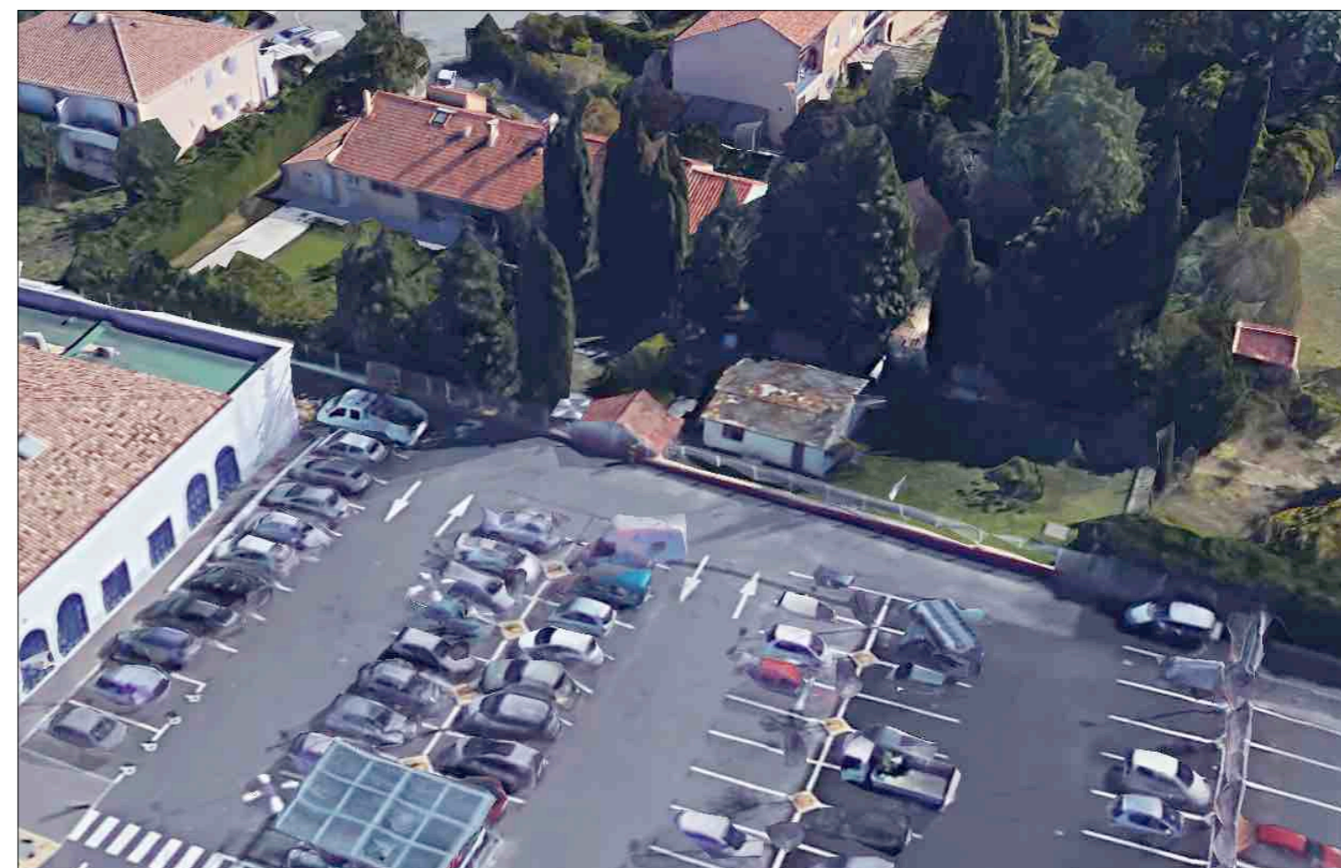
Vue 02 Photo proche (Août 2017)

B. MARECCHIA Responsable Immobilier LIDL PROVENCE 394, chemin de Favary - 13790 ROUSSET Tel. : 04 42 51 71 79