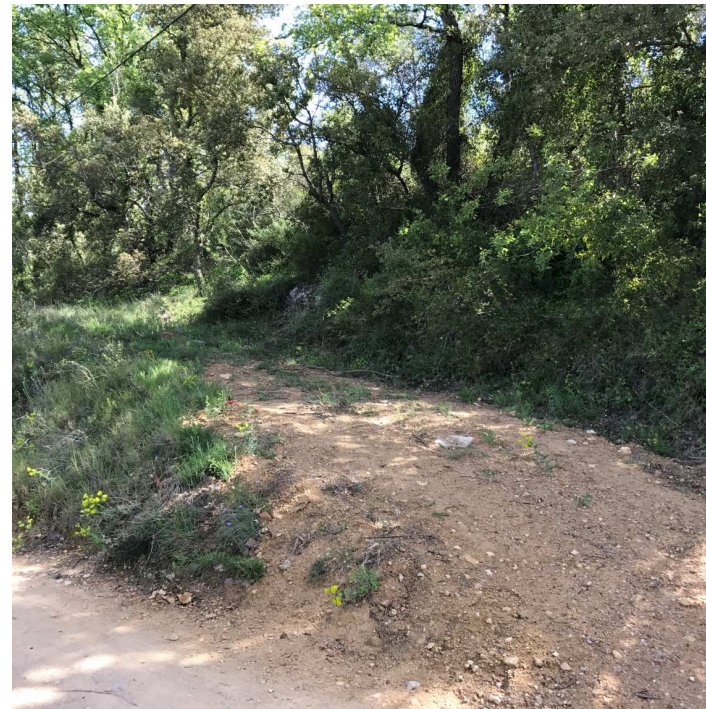
Vue de la voie d'accès au terrain objet de la demande.