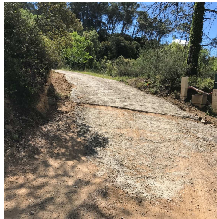
Vue de la voie d'accès aux parcelles bâties situées en contrehaut du terrain.