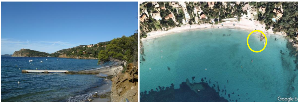
Figure 1 : Localisation du ponton flottant existant actuellement au Canadel

Pour rappel, le ponton mis en place sur la plage du Rayol sera amovible.