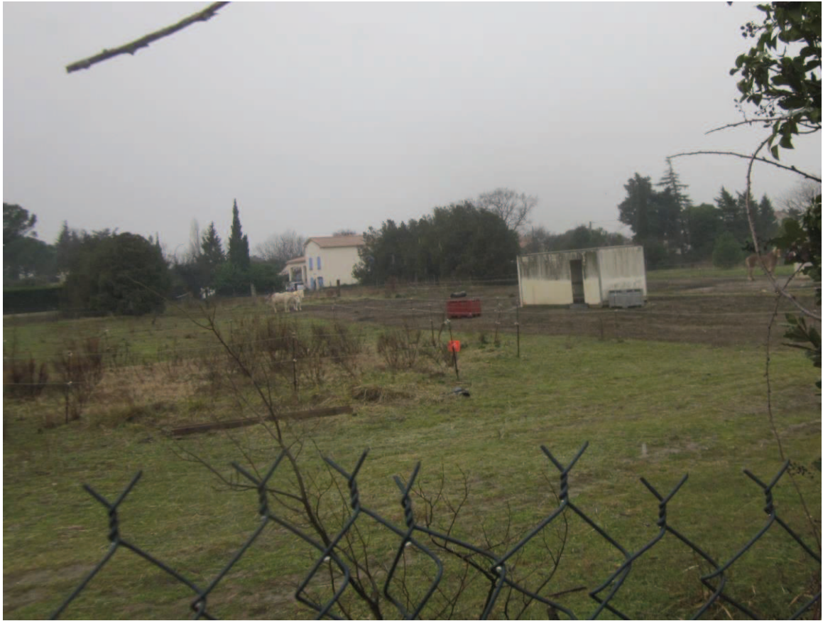
3/ Vue sur le parc à chevaux (janvier 2017)