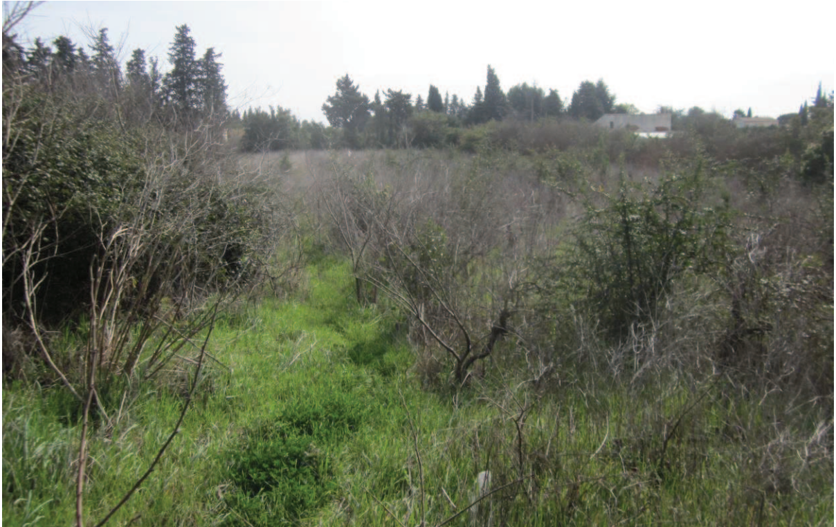
1/ Vue sur la parcelle de vignes abandonnées au Nord du secteur d'étude (janvier 2017)