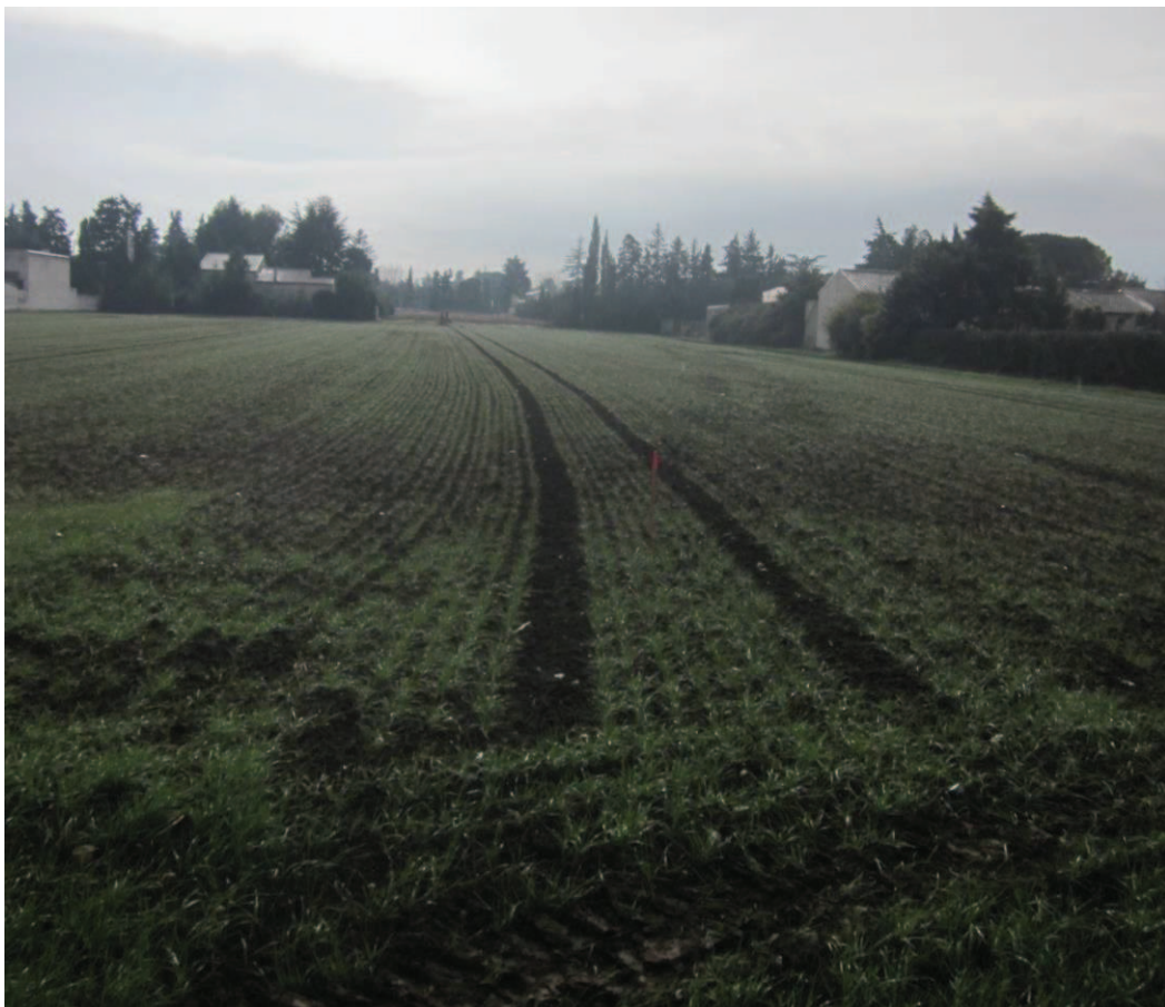
6/ Vue lointaine sur la partie Nord du site actuel (champ cultivé) au sein d'une enclave urbaine (janvier 2017)