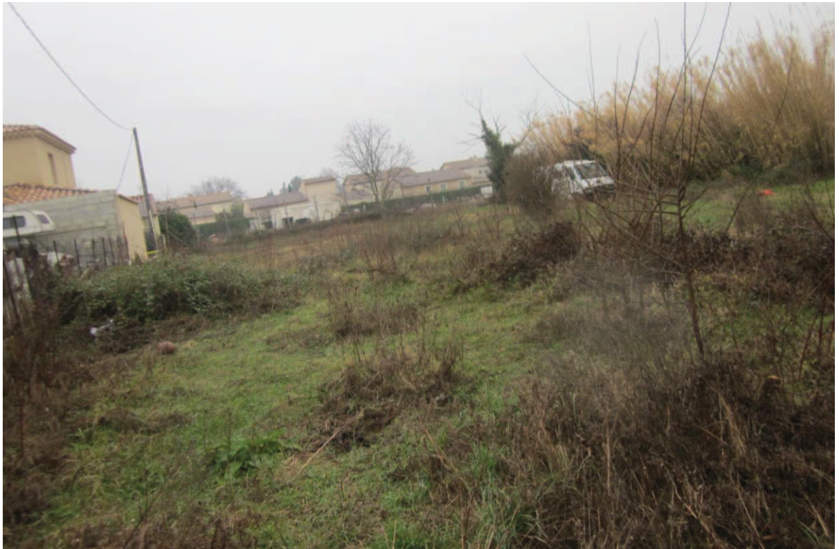
Vue sur une prairie en friche (janvier 2017)