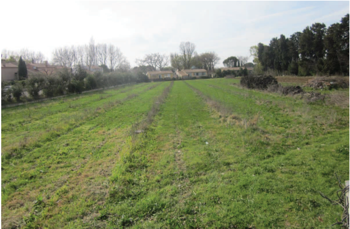
5/ Vue lointaine sur la partie Sud du site actuel au sein d'une enclave urbaine (janvier 2017)