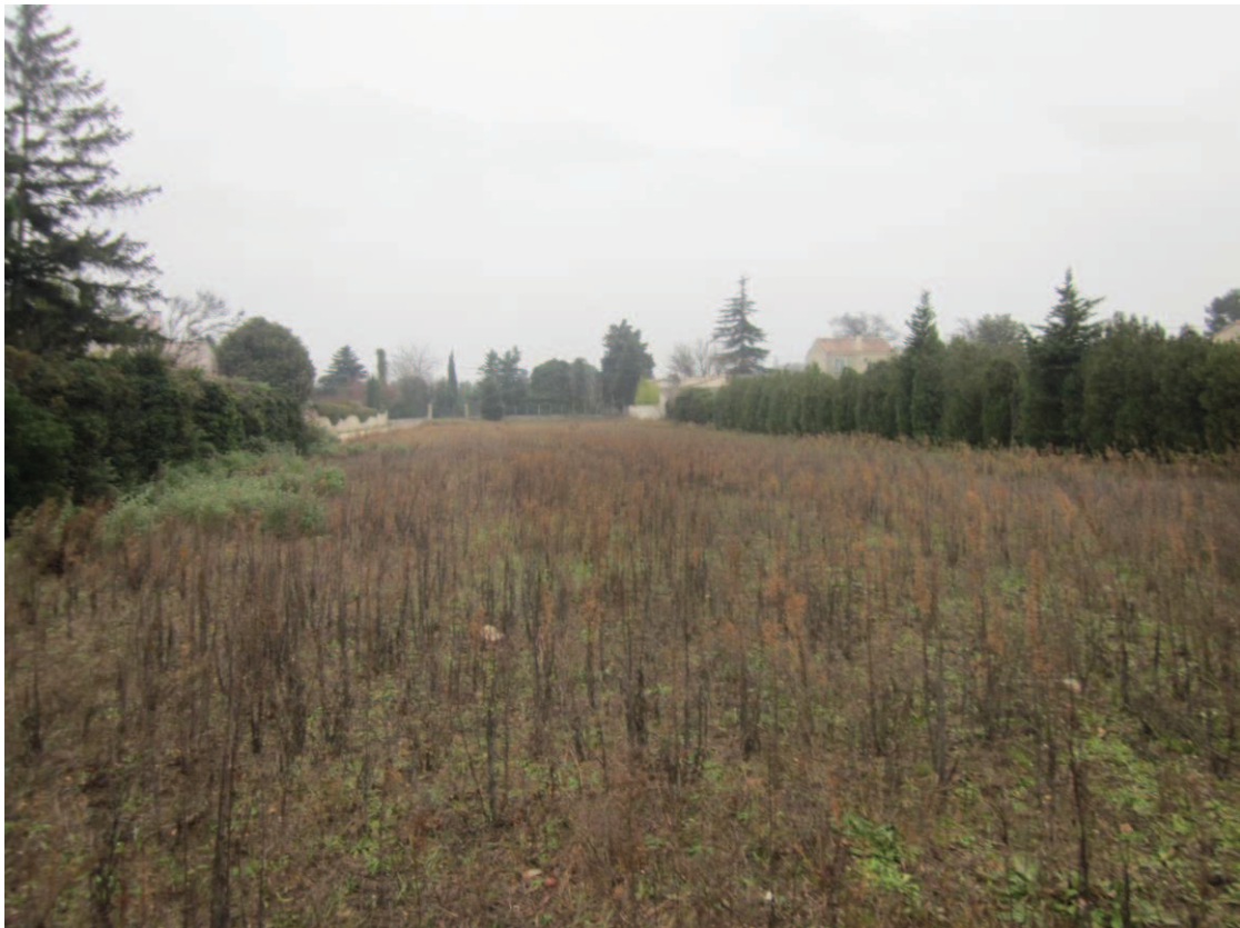
2/ Vue sur une prairie en friche au centre du secteur d'étude (janvier 2017)