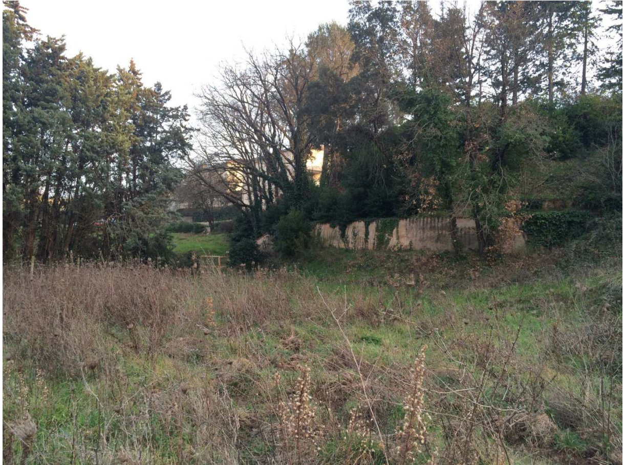
Photo 1 : vue de l'appui rive gauche du déversoir du barrage de Vaulongue depuis le bassin de dissipation