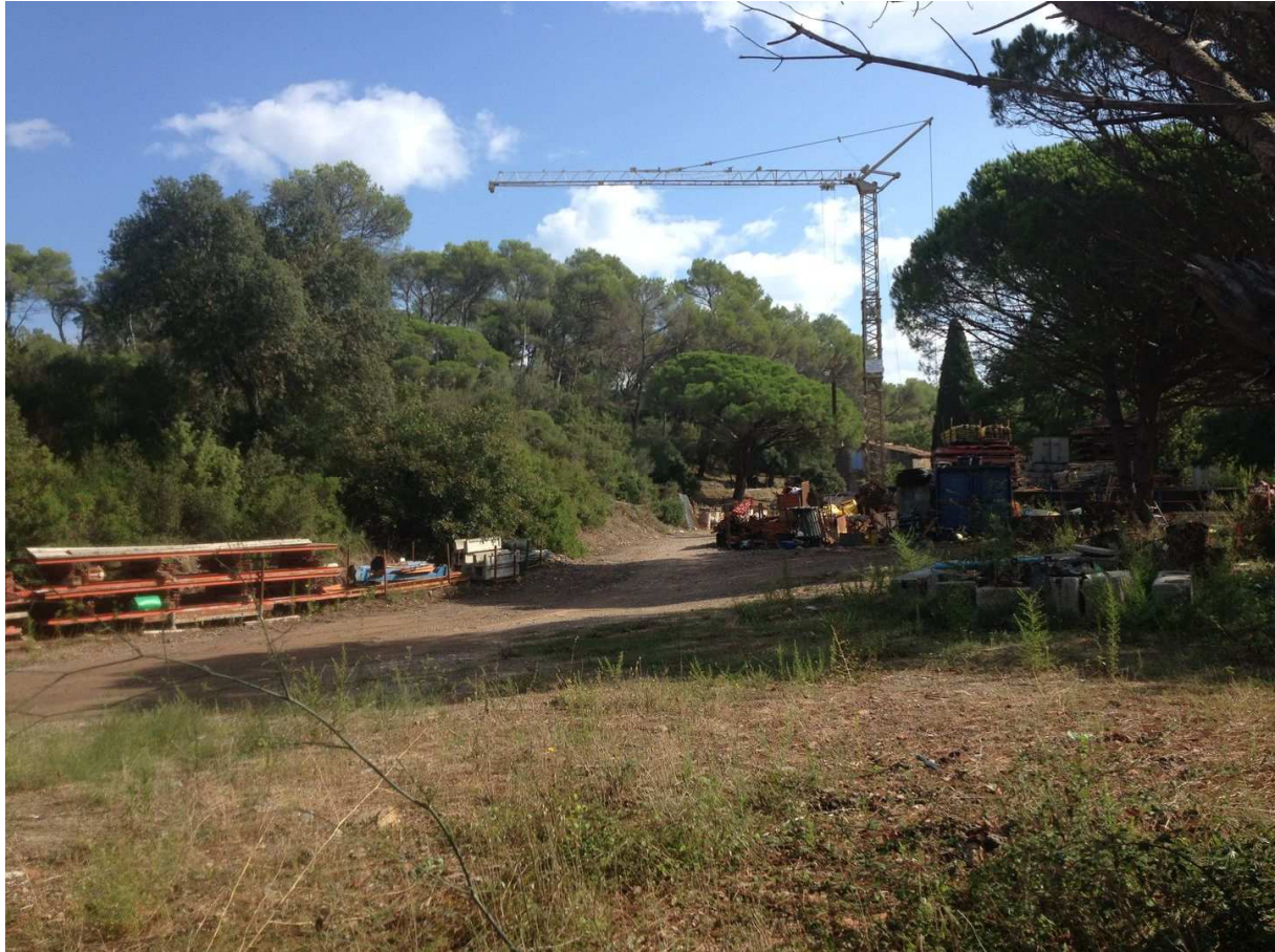
Photo 1 : vue de l'appui rive droite du barrage de l'Aspé depuis le fond de retenue