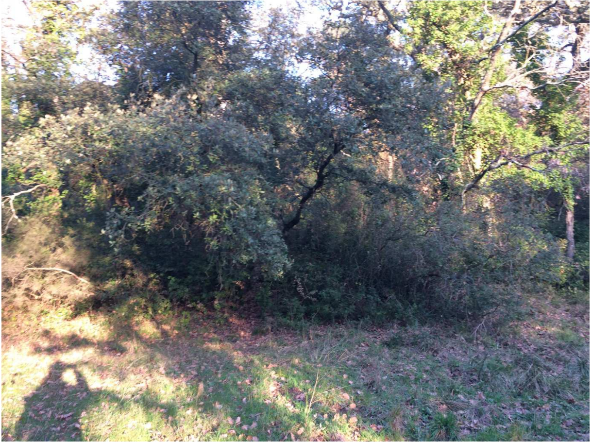
Photo 1 : vue de l'appui amont de la digue depuis le fond de retenue