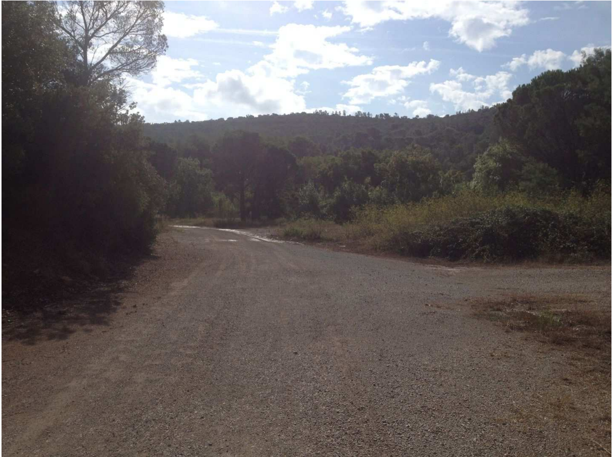
Photo 3 : vue de l'implantation du site depuis le boulevard Jacques Baudino