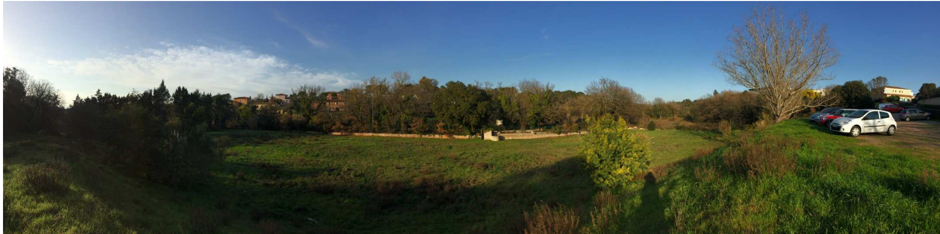
Photo 2 : vue de l'implantation du site depuis la rive gauche du bassin