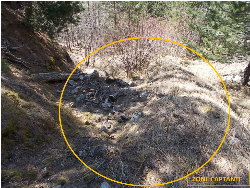
Vue depuis le haut de la zone captante vers le bas (vue vers Sud-Ouest)