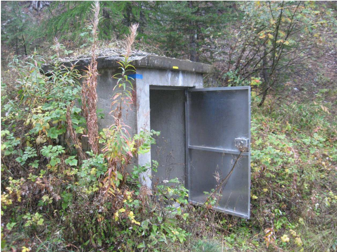
Photo de l'ouvrage de réunion des captages amont et aval