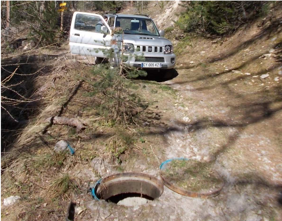
Photo du regard avec la vanne de vidange situé sur la piste d'accès (éloigné de la zone captante)