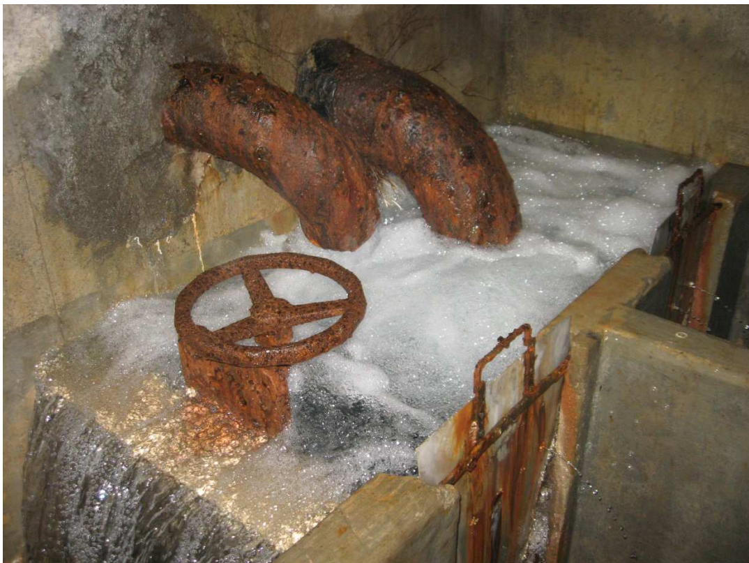
Photo intérieure de l'ouvrage de réunion