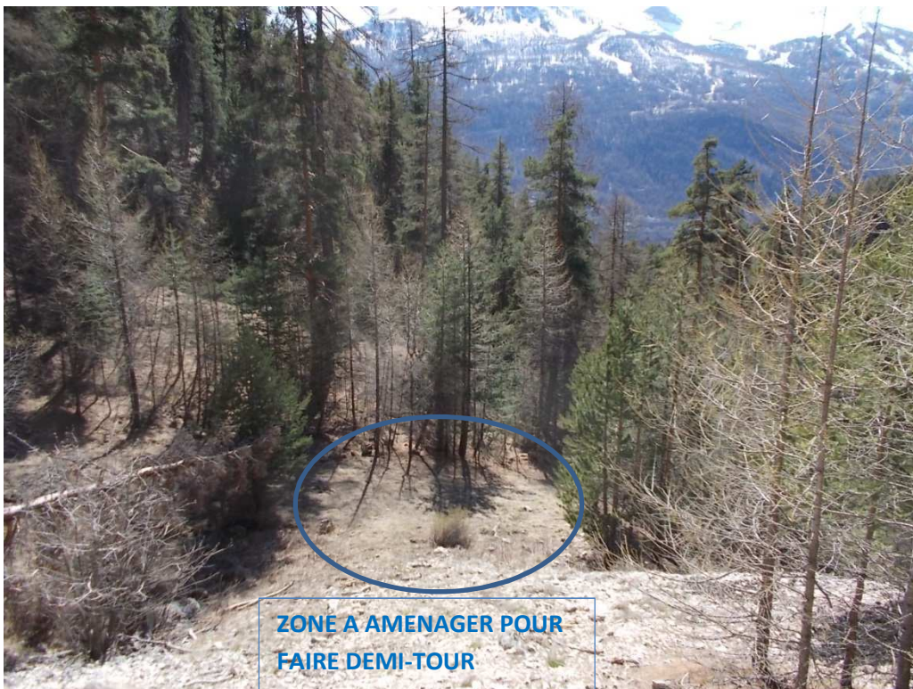
Vue depuis le chemin vers la zone envisagée pour le demi-tour (vue vers Sud-Est)