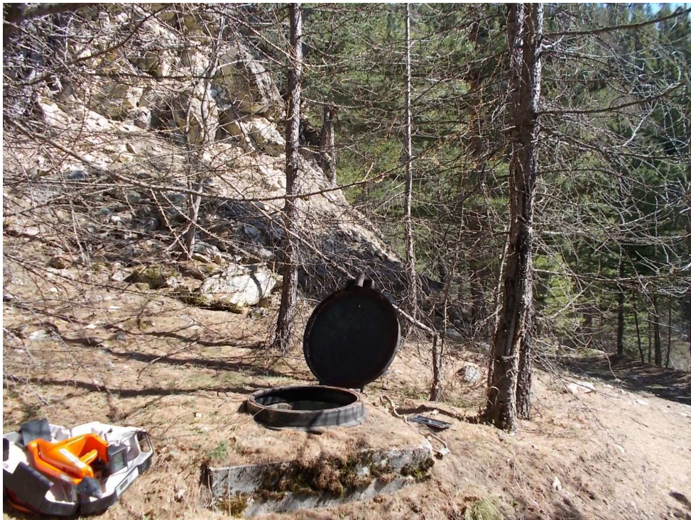
Photo du regard avec la vanne de vidange en pied de la zone captante (laissée légèrement ouverte pour créer un débit d'alimentation pour la cascade)