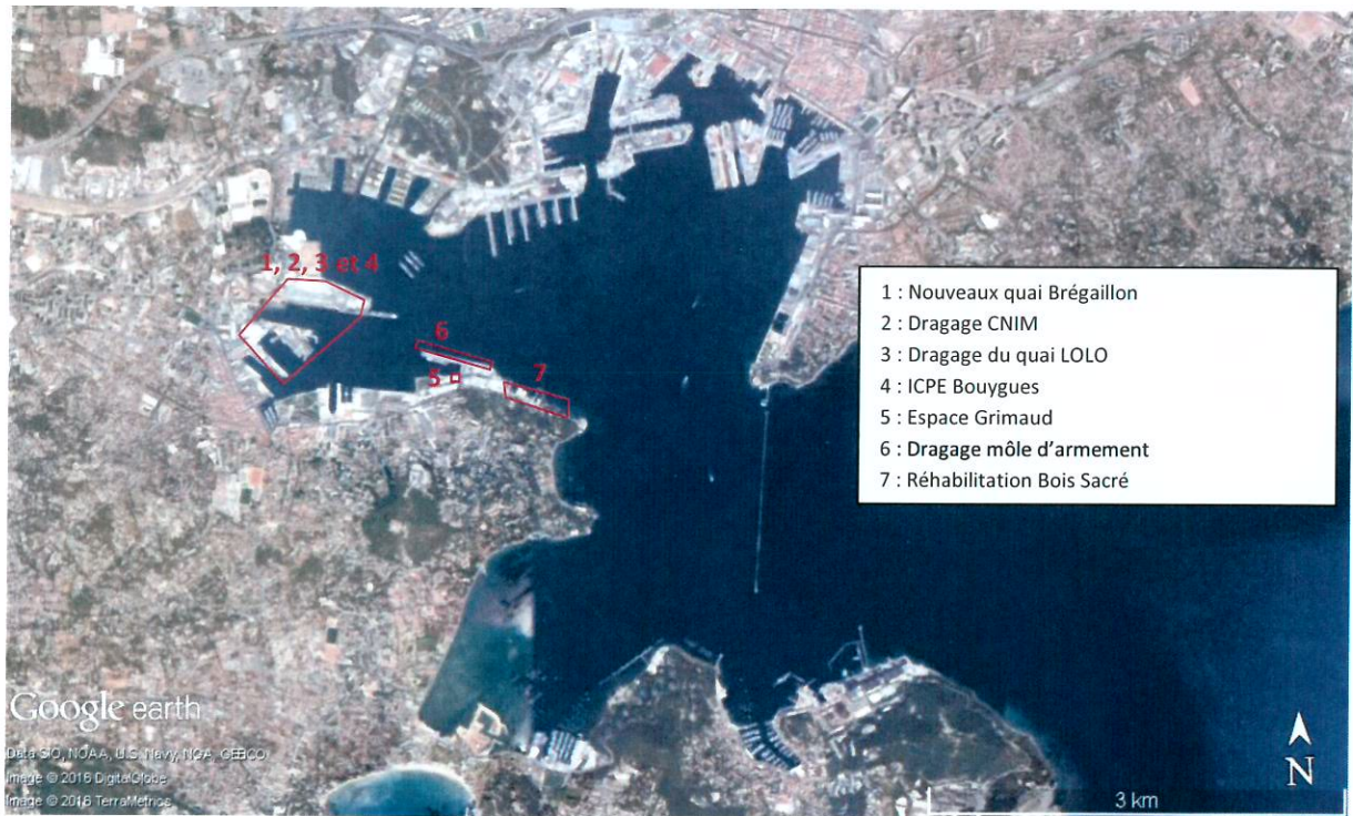
Figure 1 : Localisation des projets de travaux dans la petite rade

La figure suivante montre l'emplacement de ces différents projets.