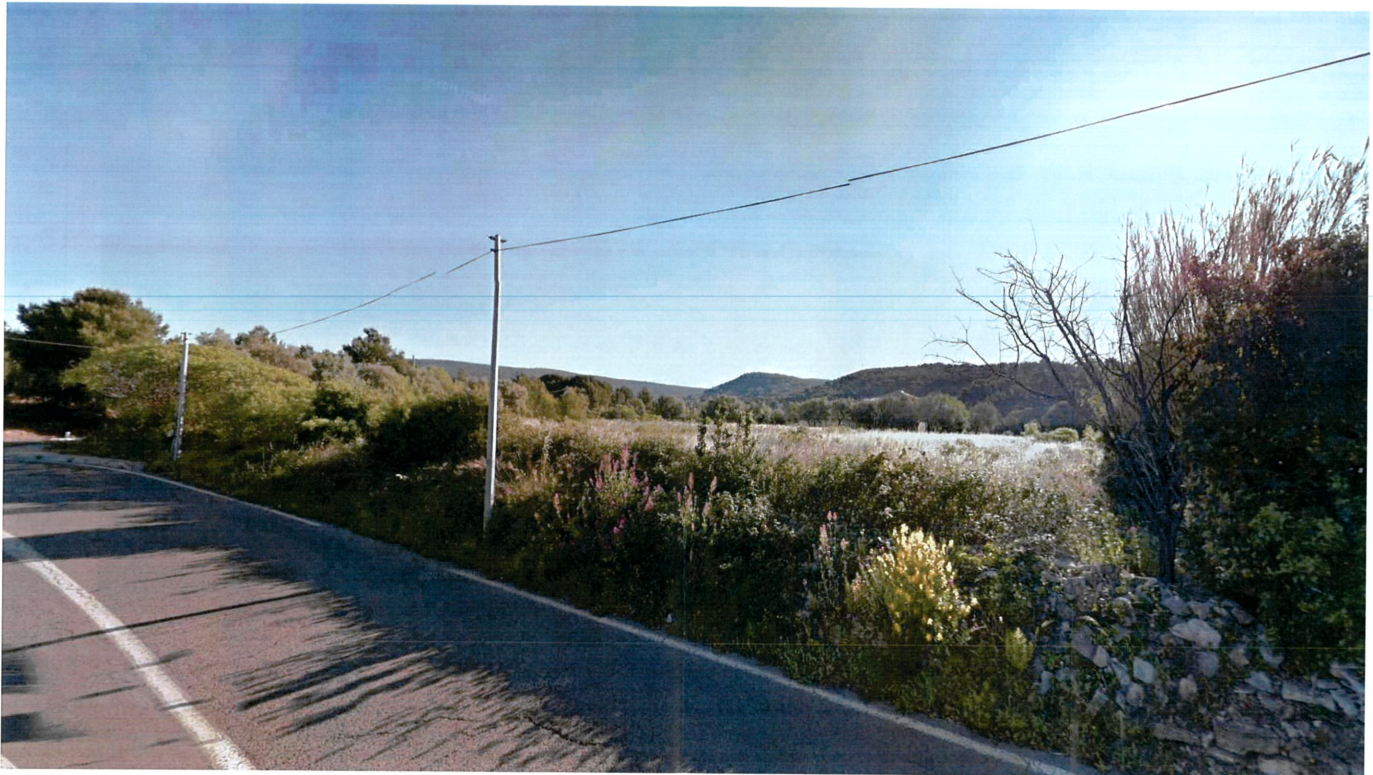
PC 07 - ENVIRONNEMENT PROCHE