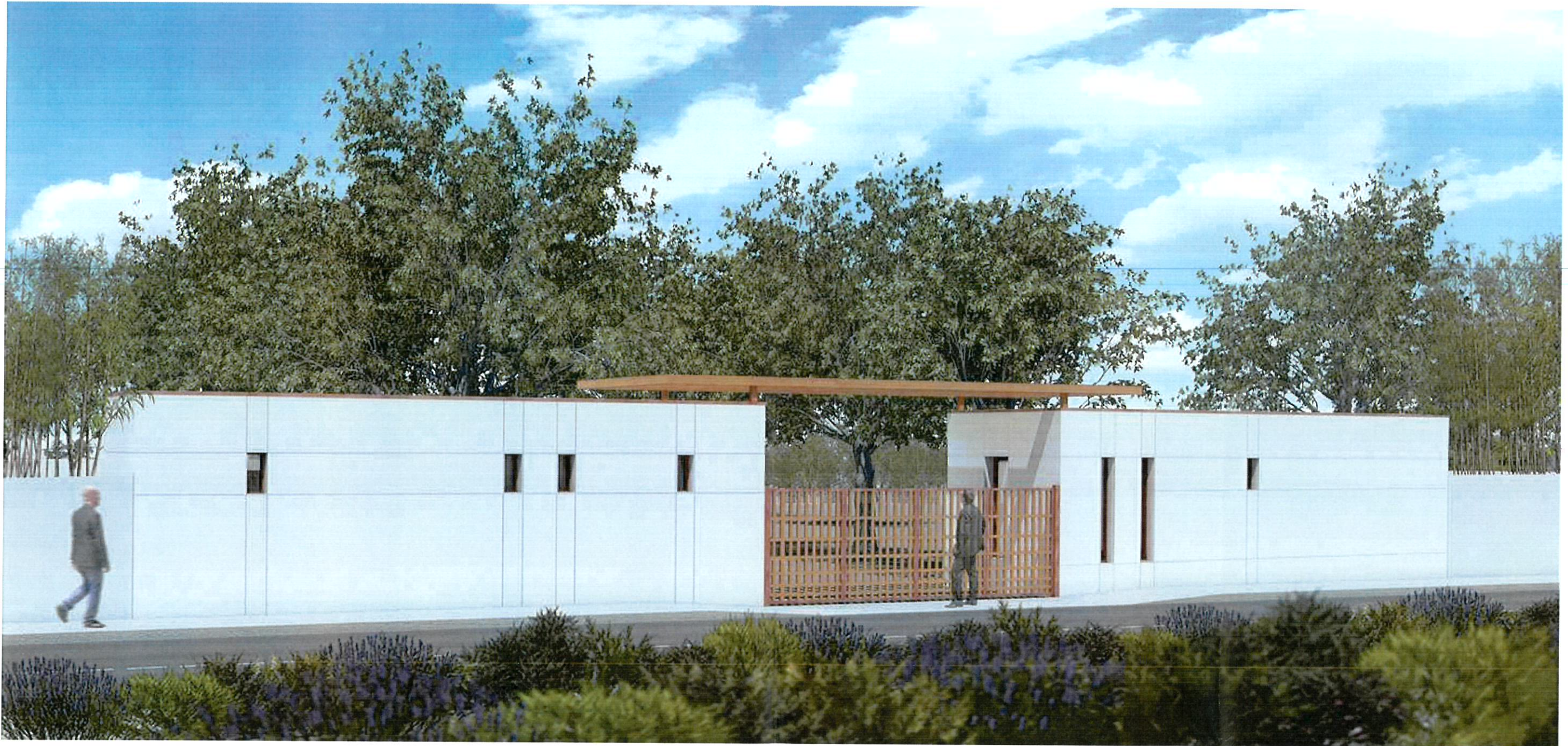
PC 06 - INSERTION