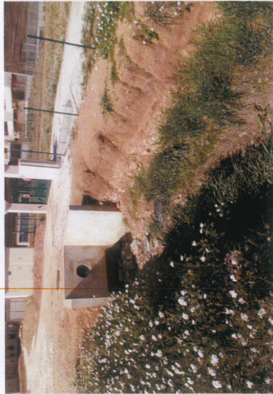
8 - Buse Ø400 et cadre / ruisseau Pas de Redon