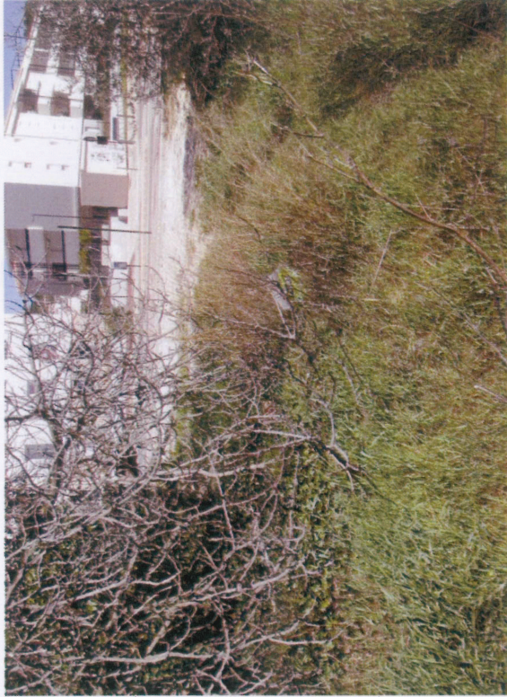
7 - absence de confection, cours d'eau dévié en amont, fossé qui s'efface progressivement à l'angle Nord-Est du site