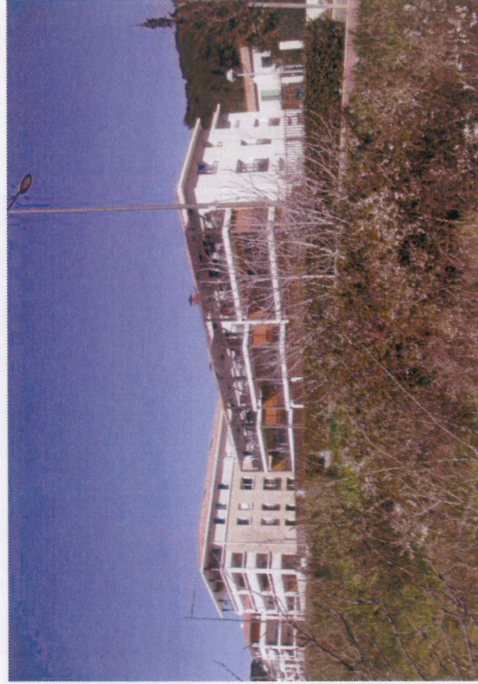
Vue 4 : Logements collectifs