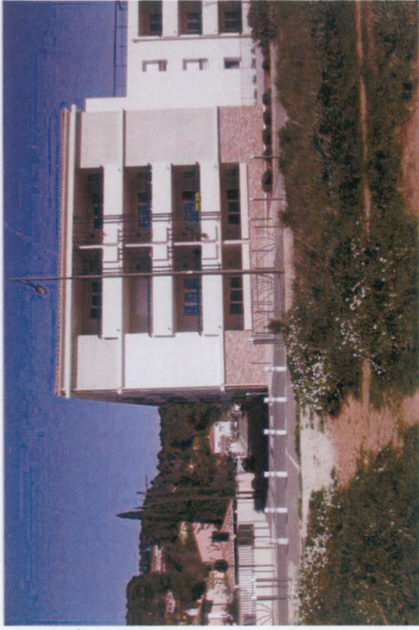
Vue 6 : Logements collectifs