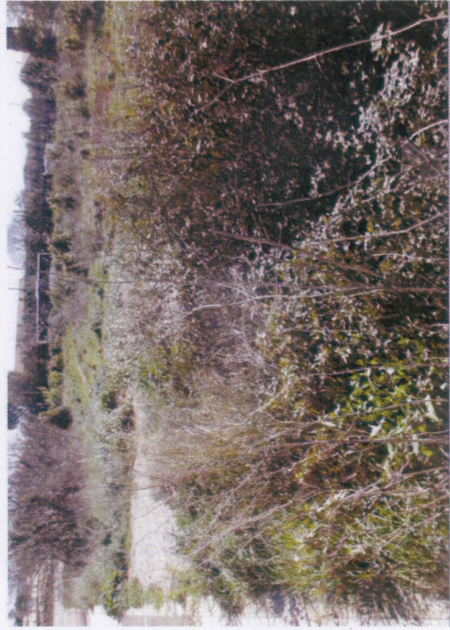
4 - Fossé obstrué par végétation et ronces