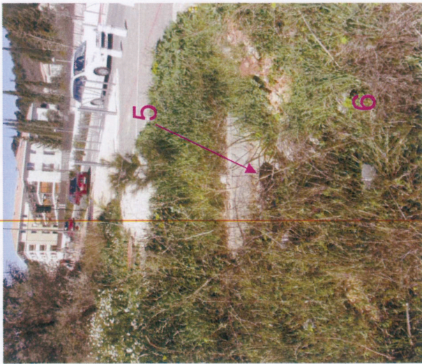
5 et 6 - Buse Ø400 et fossé enherbé