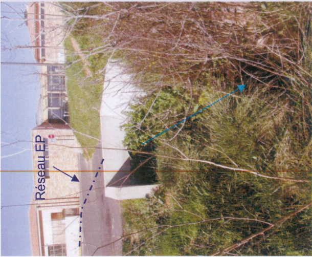
1- Buse Ø800