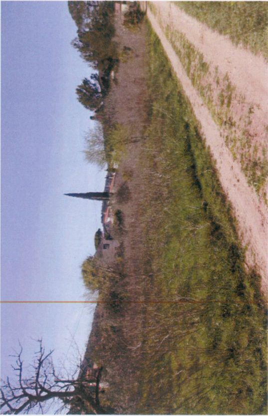
Vue 9 : Espaces en friches