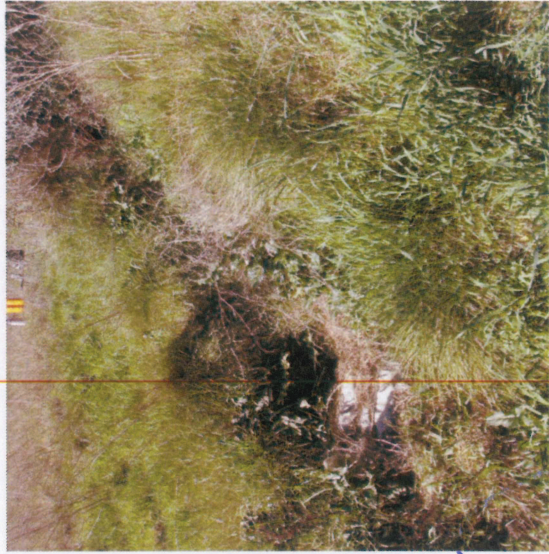
3 - Fossé en terre enherbé