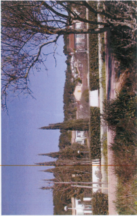
Vue 5 : Maisons individuelles