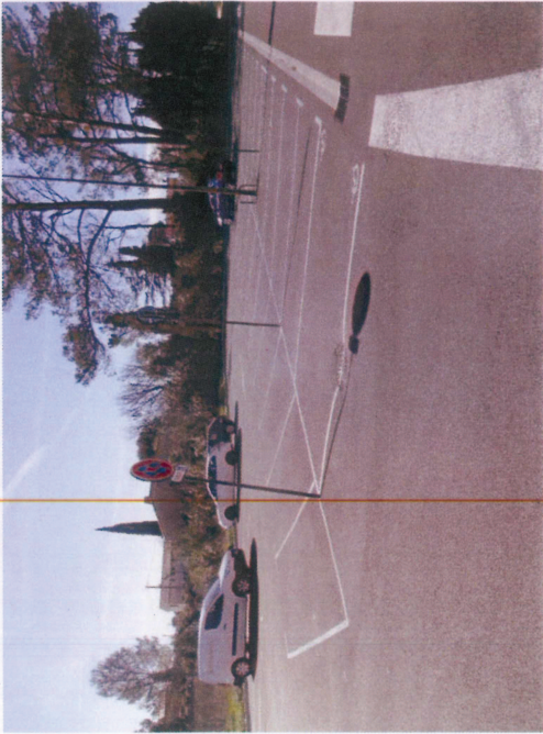
Vue 1 : Parking