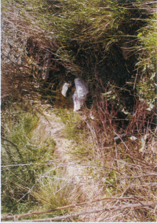
2 - Canal béton enherbé