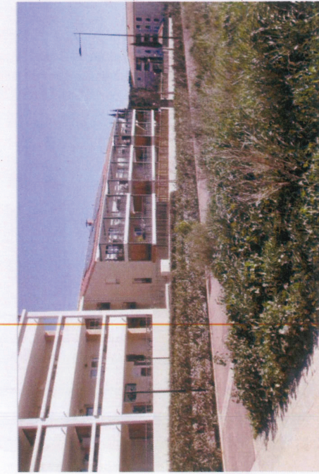
Vue 3 : Chemin piéton et logements collectifs