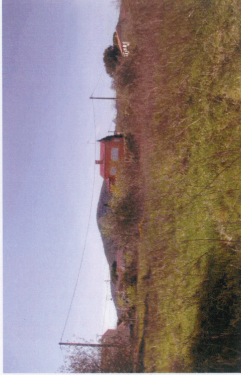
Vue 8 : Espaces en friche