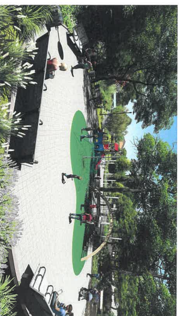
E T A T P R O J E T E