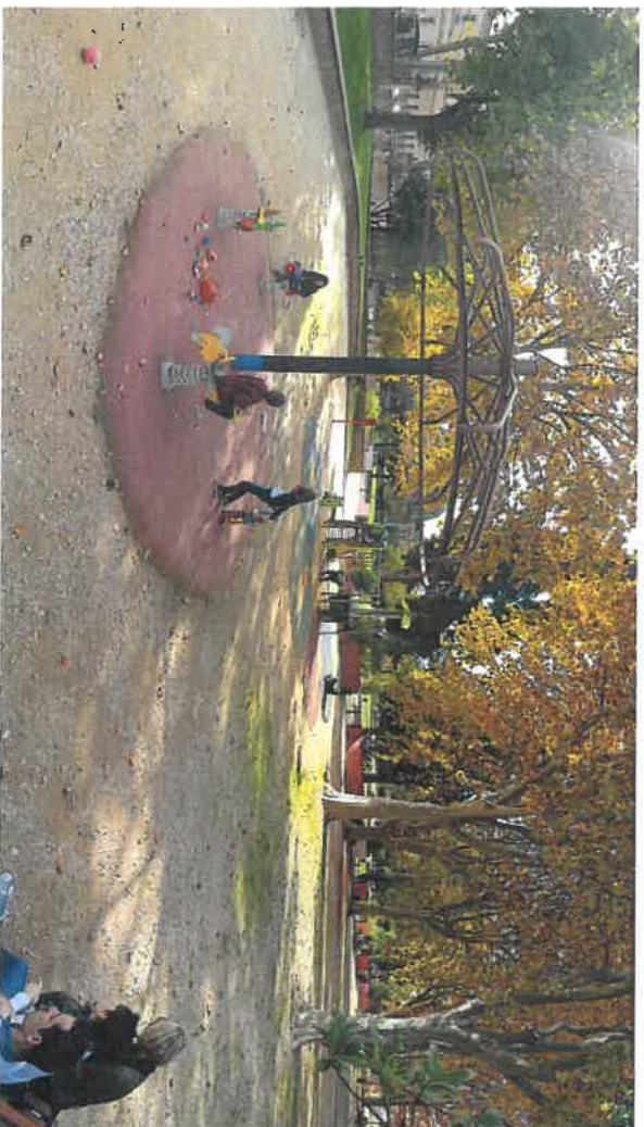
E T A T A C T U E L