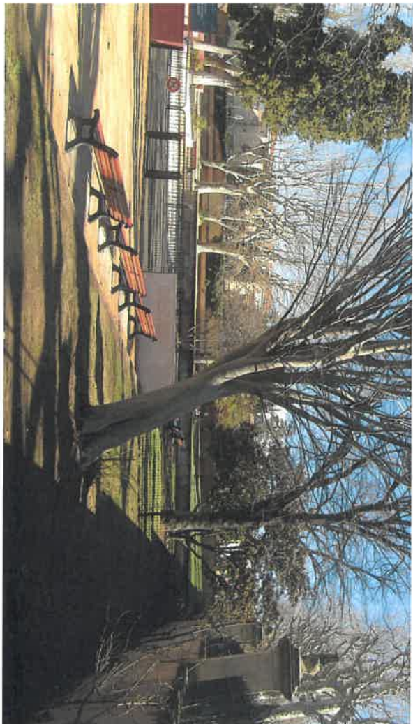
E T A T A C T U E L