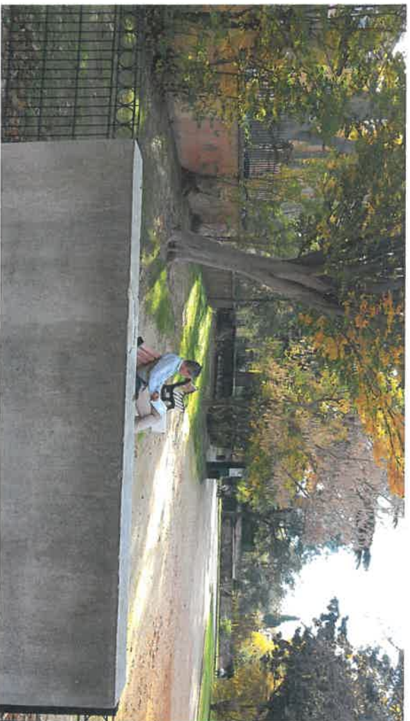
E T A T A C T U E L L