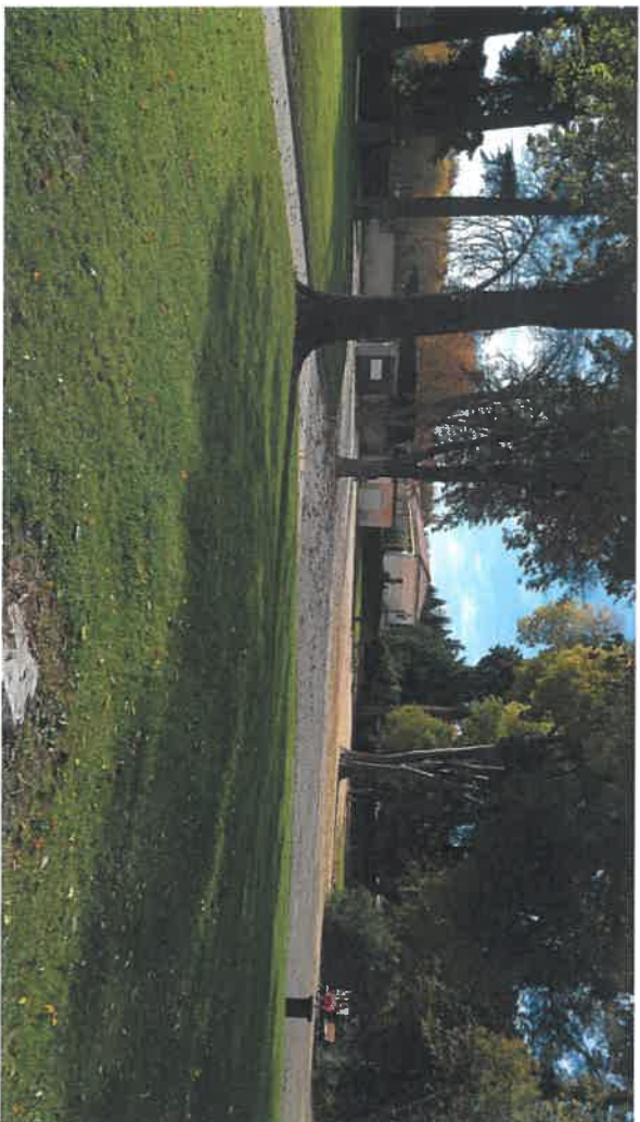
E T A T A C T U E L