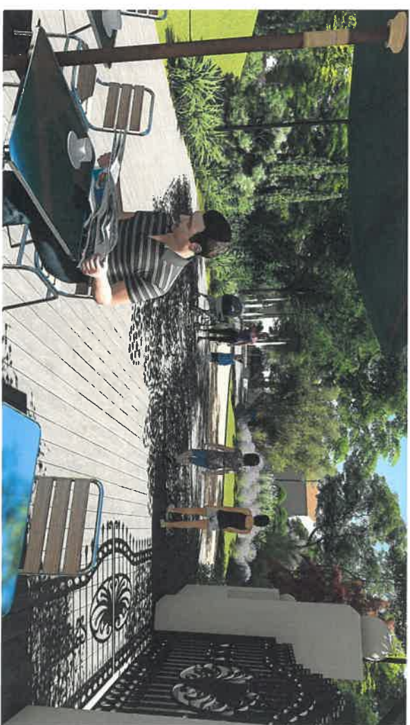
E T A T P R O J E T E