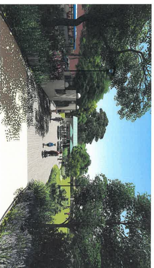
E T A T P R O J E T E