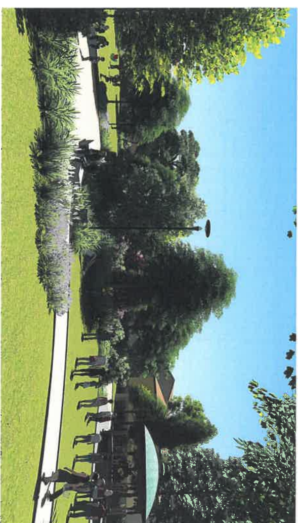
E T A T P R O J E T E