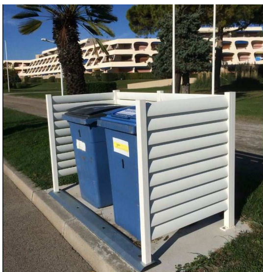
Figure 2 : type de panneaux pare-vue qui pourront être fixés sur la dalle béton

Au voisinage de cette dalle sera également installé, dans le cadre du lotissement « Clos Sainte Thérèse Haut », un bloc de 6 boîtes aux lettres sur pieds métalliques (voir figure 3), ainsi que si nécessaire un éventuel compteur général d'eau potable et un coffret de coupure ERDF. Le lotissement « Clos Sainte Thérèse Bas » bénéficiera également de ces équipements.