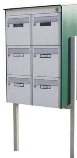
Figure 3 : type de bloc de 6 boîtes-aux-lettres qui pourra être installé