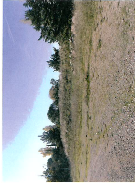
Vue sur les terrains en friche