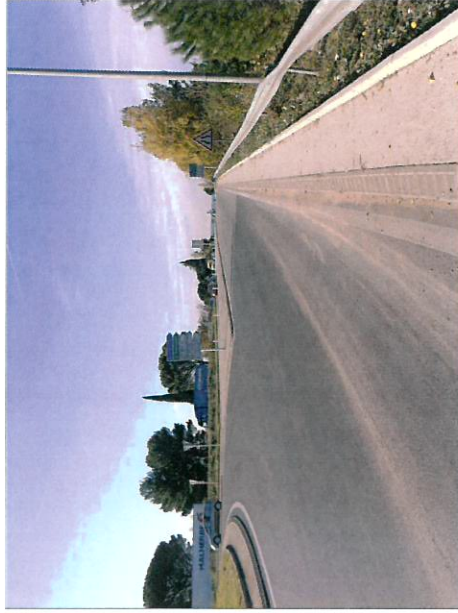
Vue sur le giratoire Georges Coutron au-niveau du raccordement du projet