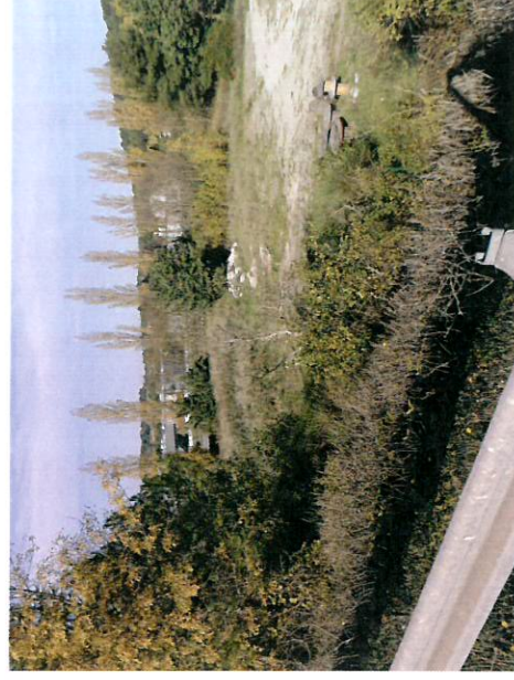
Vue depuis le raccordement du projet sur les emprises de la future bretelle