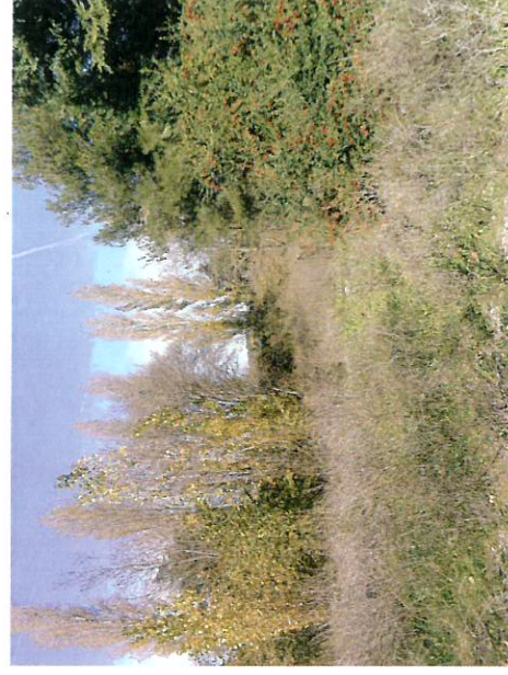
Vue sur l'extrémité Sud du boisement existant