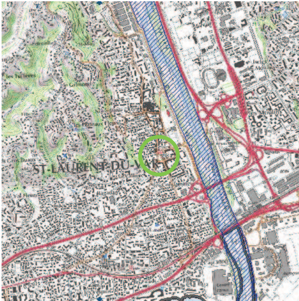
Situation du projet vis-à-vis de la Zone de Protection Spéciale Basse vallée du Var (en vert : emplacement du projet – hachuré bleu : ZPS)