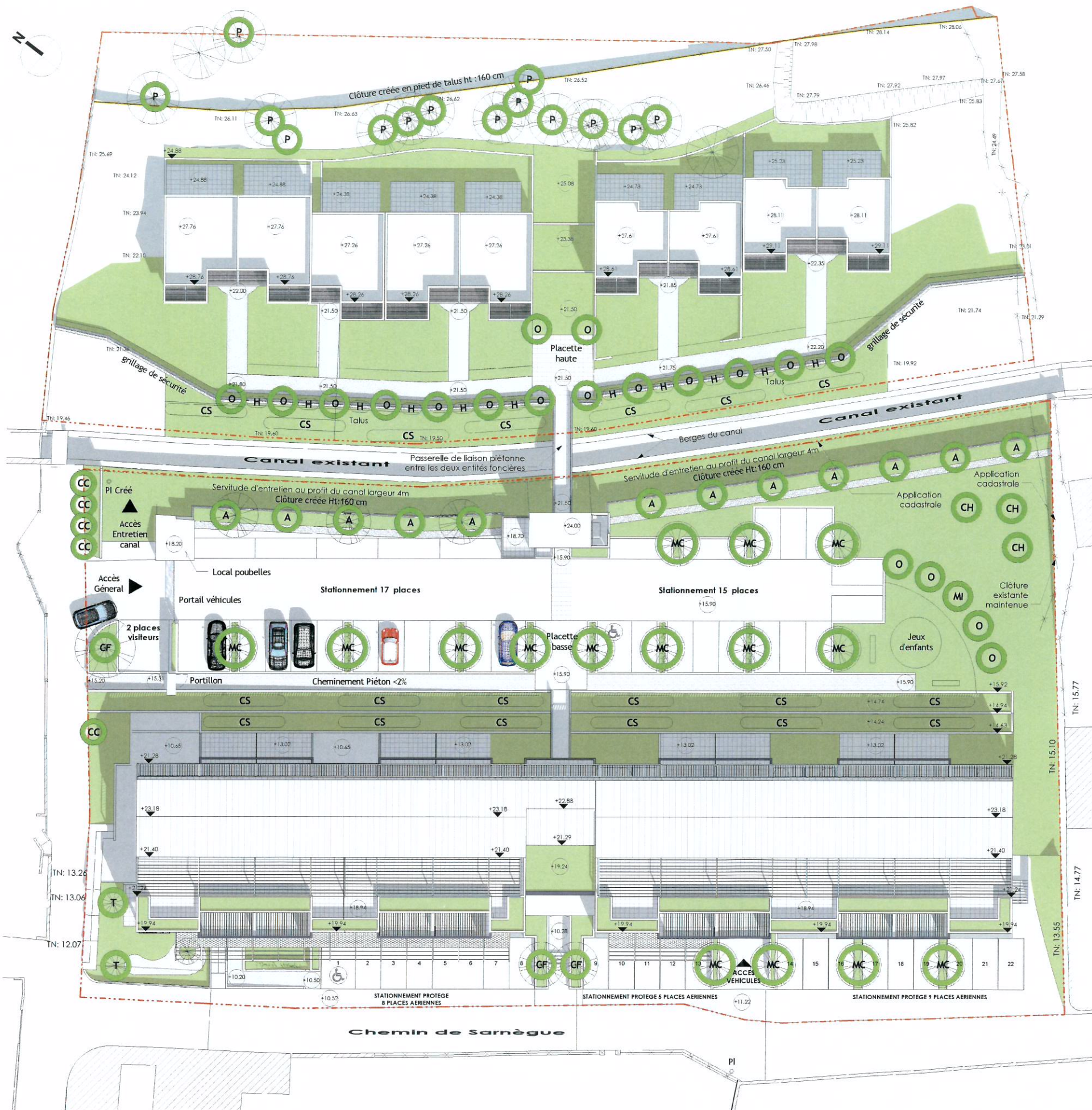
Bilan végétal concernant les parcelles N° 94 et 95