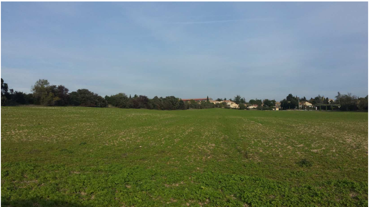
Photo 3 : Vision de la partie sud du barreau de liaison en provenance d'Orange (RD 976) – Novembre 2016