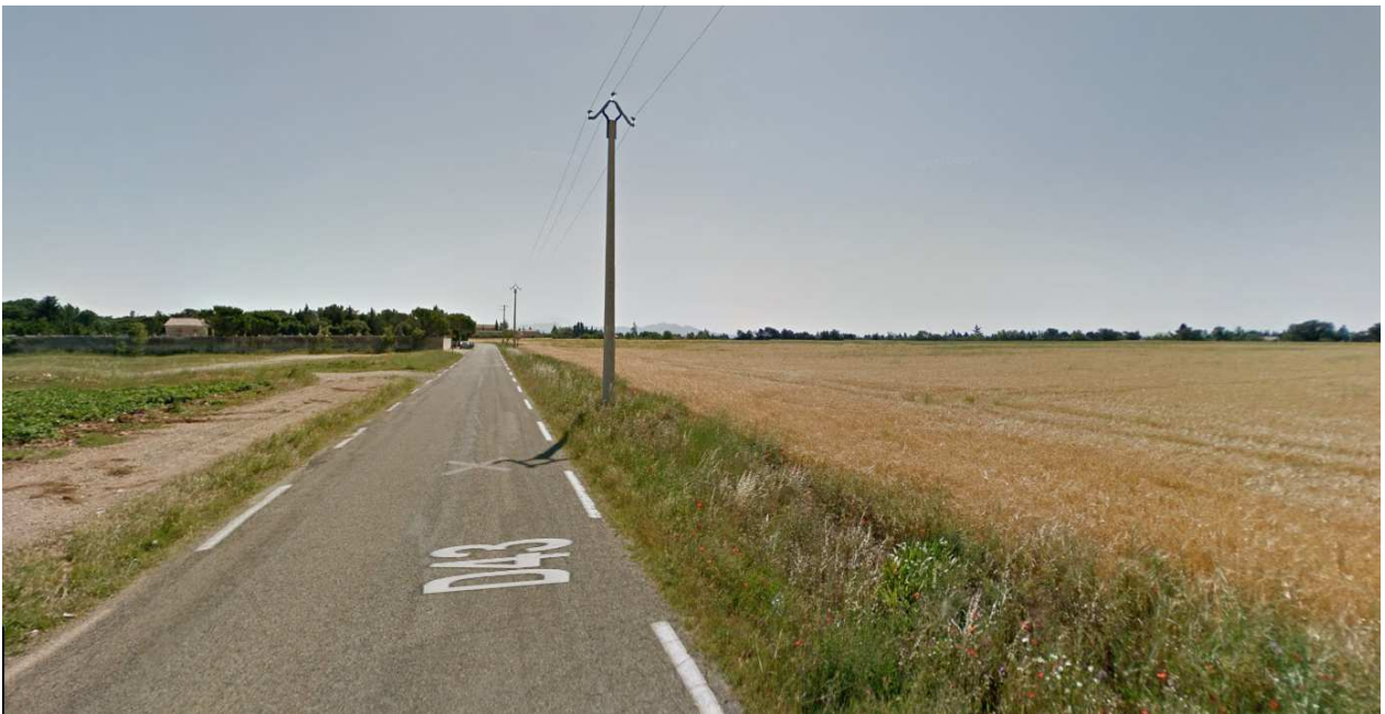
Photo 9 : vision depuis la RD 43 en provenance de Piolenc – janvier 2010