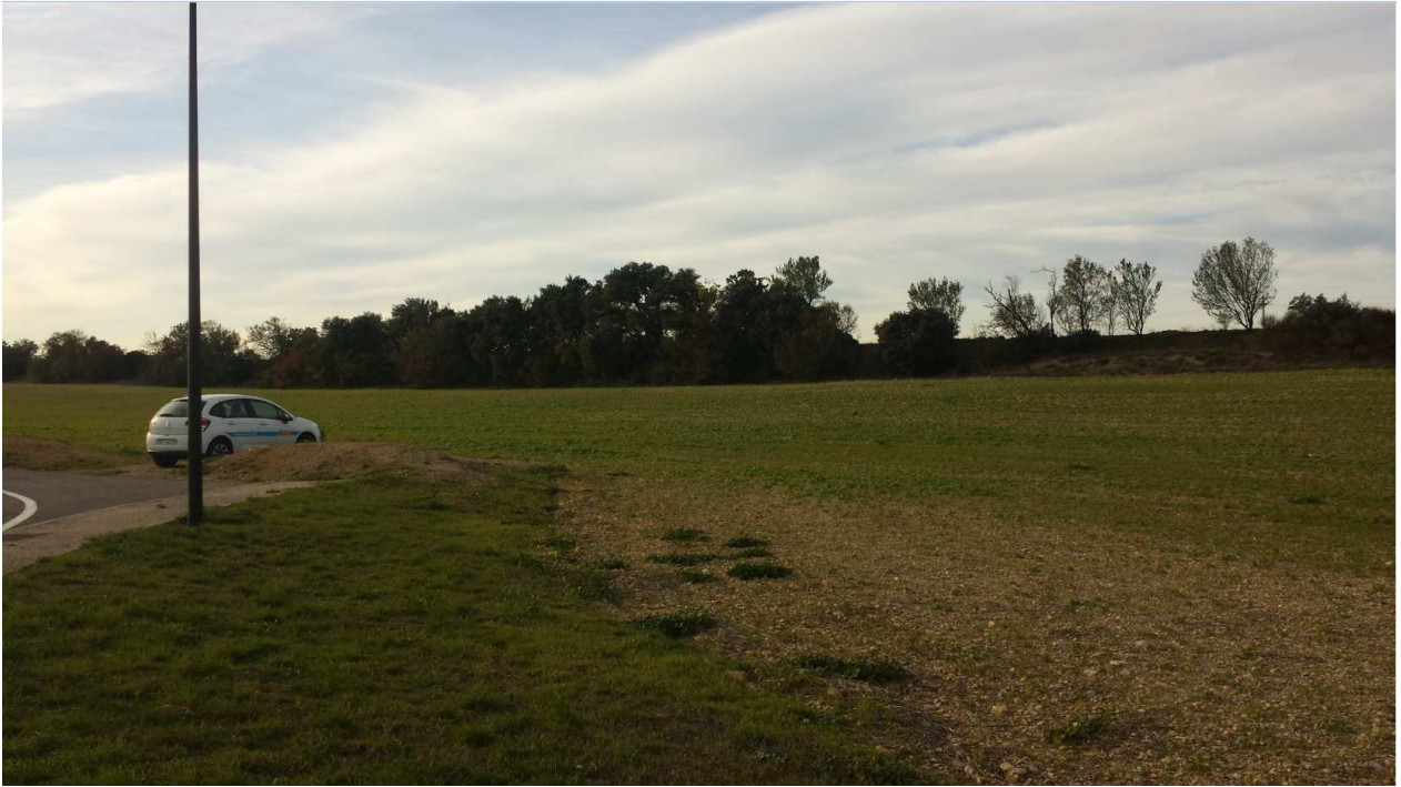
Photo 6 : vision du départ du barreau de liaison depuis le giratoire de l'Harmas - Novembre 2016