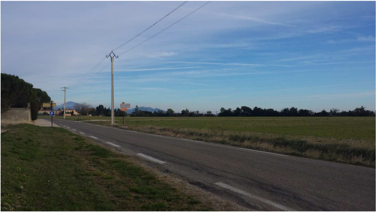
Photo 8 : vision depuis la RD 43 en provenance de Piolenc – Novembre 2016