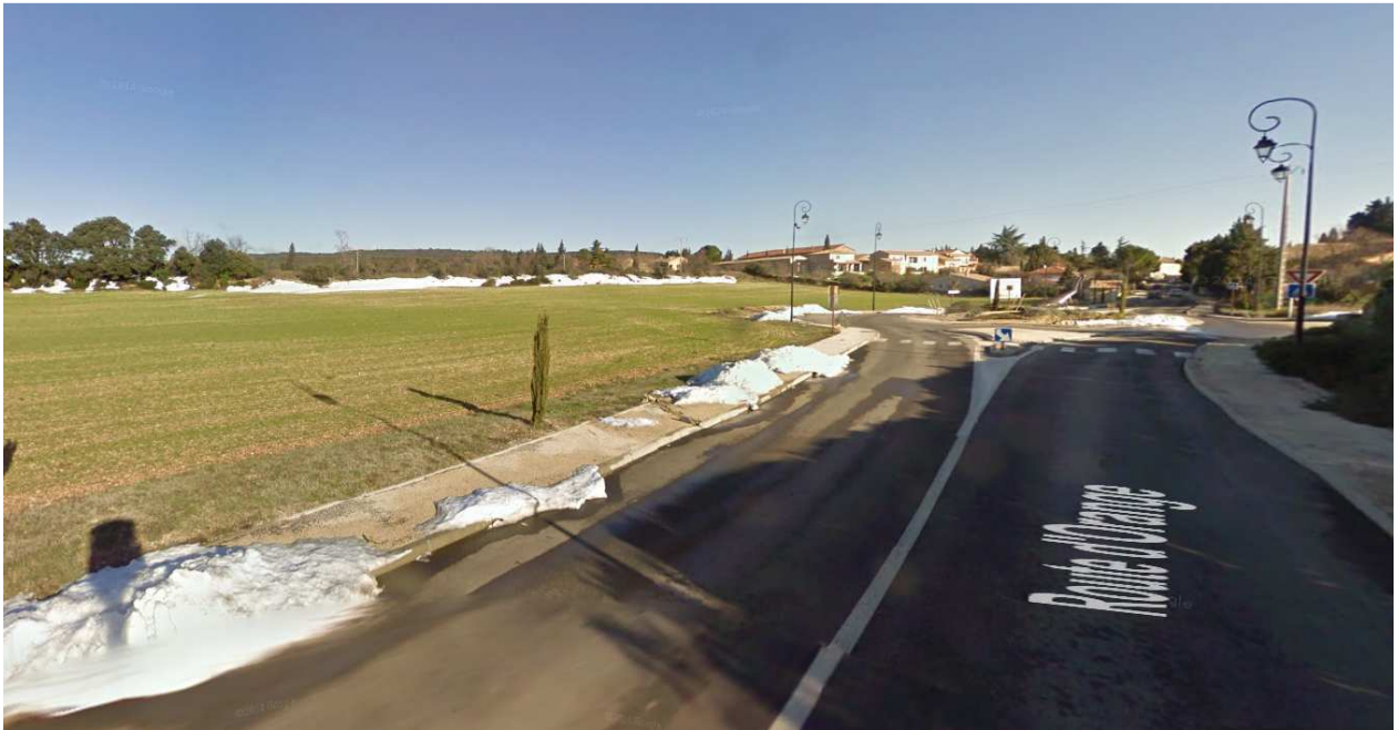
Photo 2bis : Vision en provenance d'Orange (RD 976) – Janvier 2010