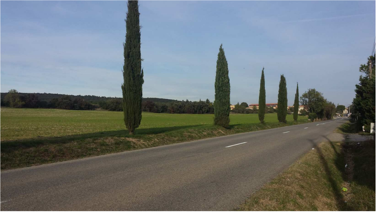
Photo 1 : Vision en provenance d'Orange (RD 976) à 300 m du giratoire – Novembre 2016