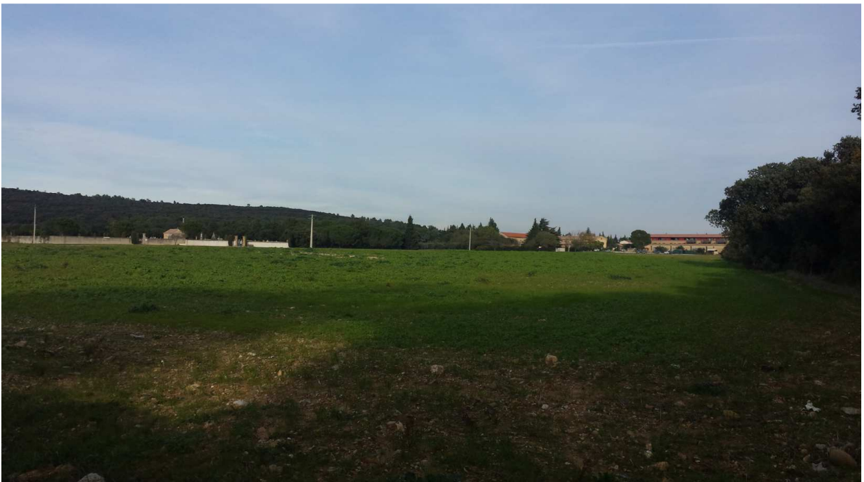
Photo 5 : Vision de la partie Nord du barreau de liaison depuis le chemin– Novembre 2016