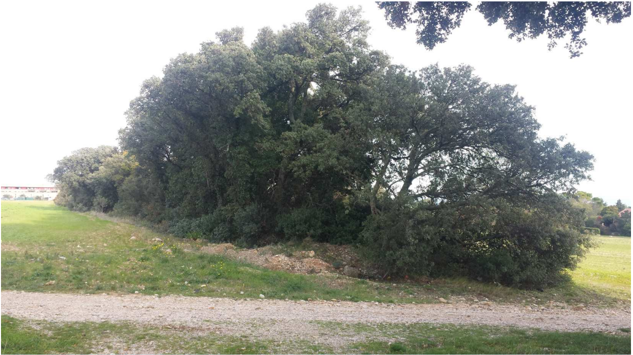
Photo 4 : Vision de la butte végétalisée à franchir – Novembre 2016