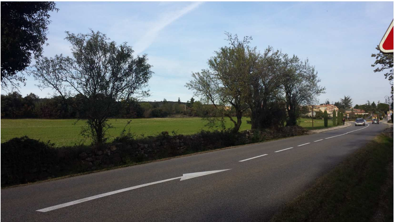
Photo 2 : Vision en provenance d'Orange (RD 976) à 150 m du giratoire – Novembre 2016