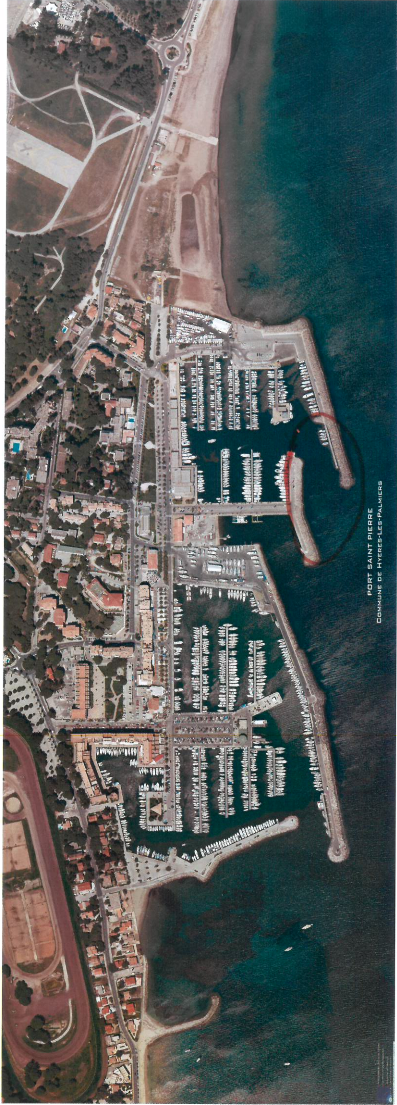
PORT SAINT PIERRE COMMUNE DE HYERES-LES-PALMIERS