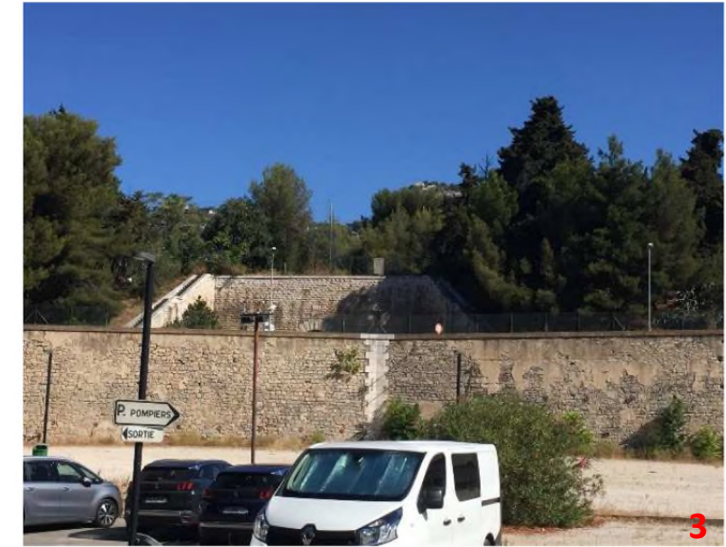
Vue depuis la zone logistique Zenith