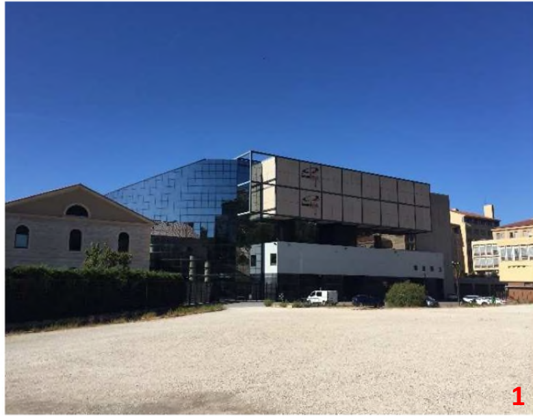
Vue depuis le parking Logistique sur le ZENITH