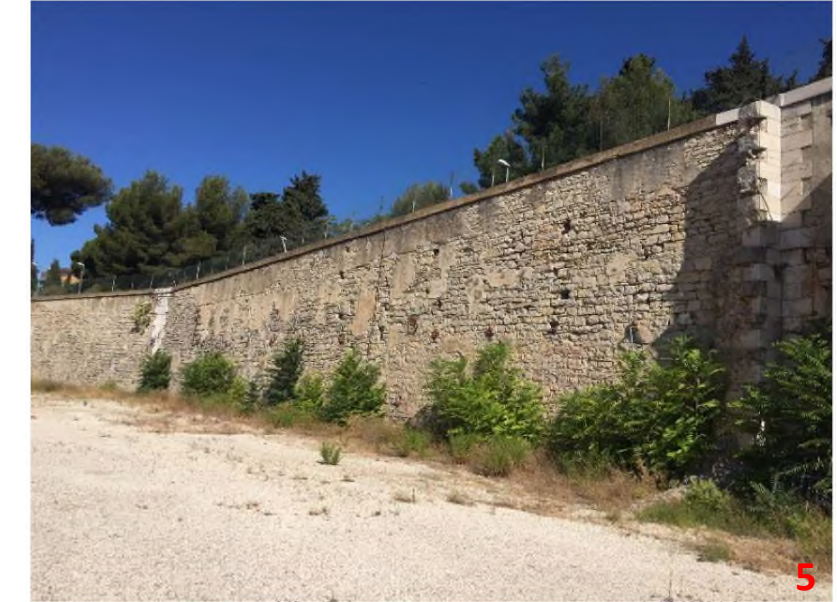
Vue depuis le terrain bas zone logistique ZENITH