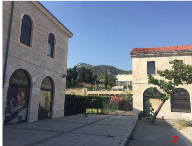
Vue depuis le parvis du ZENITH en direction du parc des Lices