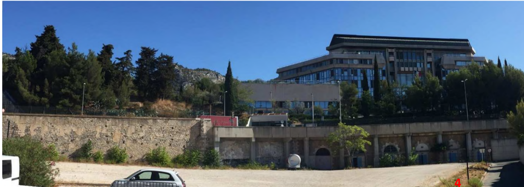
Panoramique depuis la zone logistique