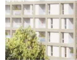
Une façade épaisse et ordonnée