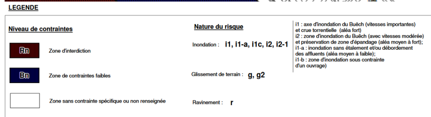
Figure 1 : source : http://www.hautes-alpes.gouv.fr/IMG/pdf/LARAGNE_PPR_Zonage.pdf

Zone du projet, non concernée par des risques naturels