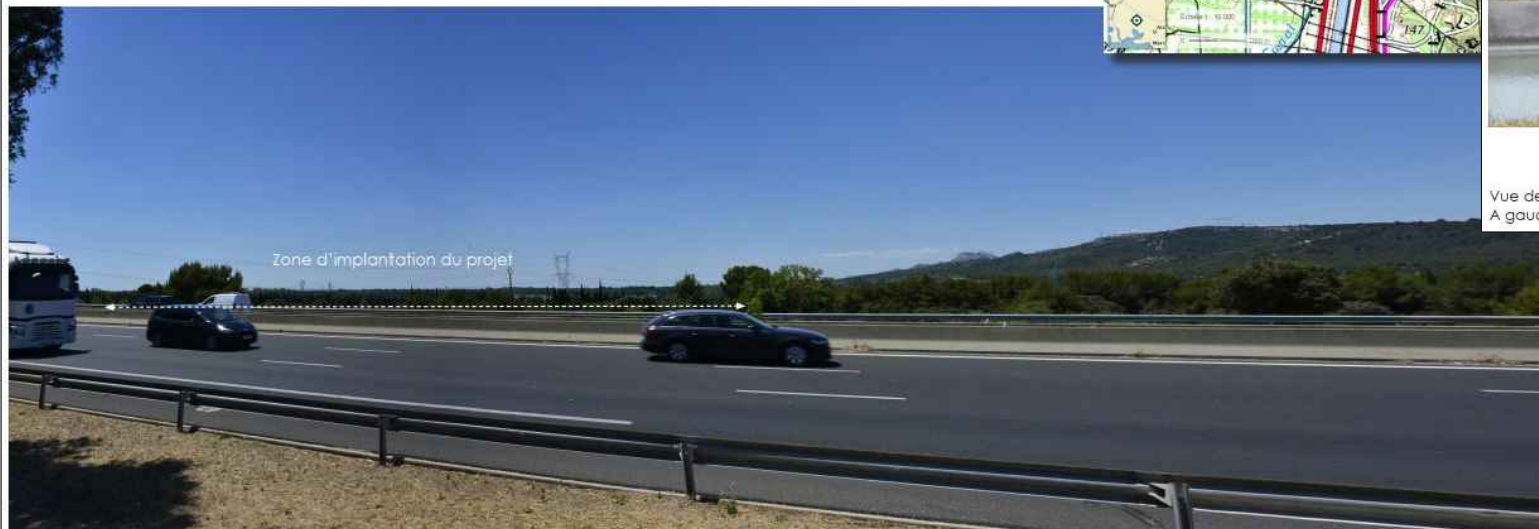
Vue vers les Alpilles, en bordure de l'aire de repos de Lamanon. Comme sur la vue précédente, la position en contrebas du site faisant l'objet du projet, limite très fortement la perception du projet. Il ne remet pas en cause la qualité des perspectives vers les Alpilles en arrière plan, tant l'aménagement restera discret dans le paysage.