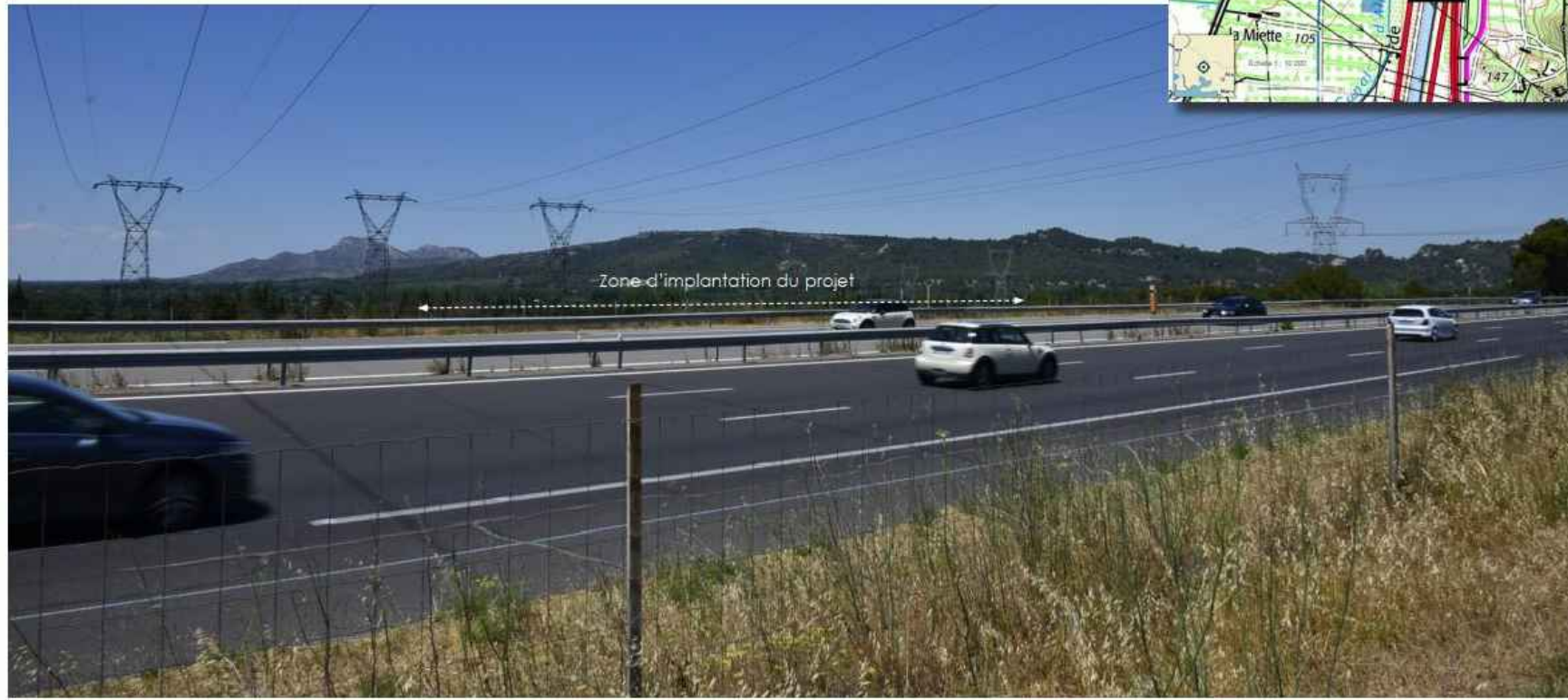
Vue vers les Alpilles juste avant l'accès à l'aire d'Autoroute A 7 en direction du nord. La position du site en contrebas de l'autoroute (plus bas entre 15 et 20 m) limite les perceptions possibles vers le site. Elles seront dès lors très partielles et filtrées par les écrans végétaux en avant-plan (bordure boisée le long de la RD 538 et du canal d'Alleins ou en bordure de l'A7 même).