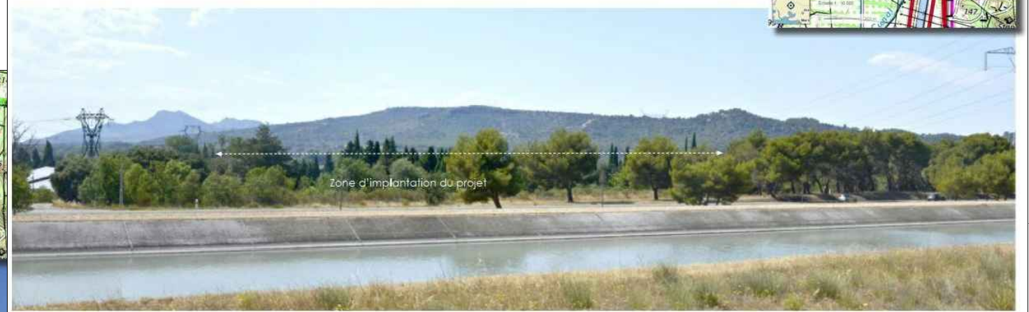
Vue depuis la bretelle de sortie du péage autoroutier. La position dominante de la voie permettra d'apercevoir le projet entre les frondaisons des arbres bordant la RD 538 et le canal d'Alleins. A gauche la vue permet d'apercevoir les deux hangars photovoltaïques déjà en place.