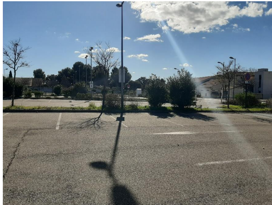
Vue 5 : Photographie depuis le nord de la zone de stationnement (environnement proche - Février 2020)