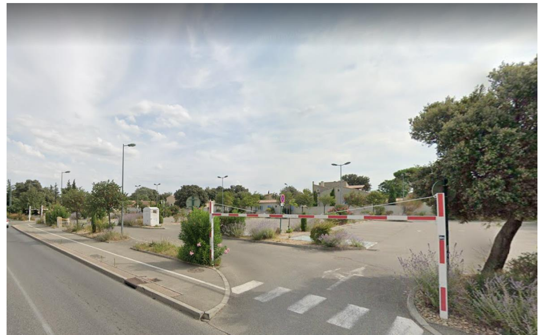
Vue 4 : Photographie depuis l'accès au parking rue de Folard (environnement proche - Août 2019)