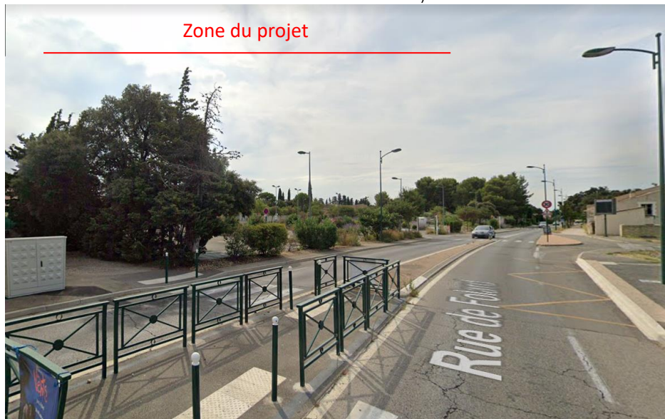
Vue 2 : Photographie depuis la rue de Folard en direction du Sud (Paysage lointain – Août 2019)