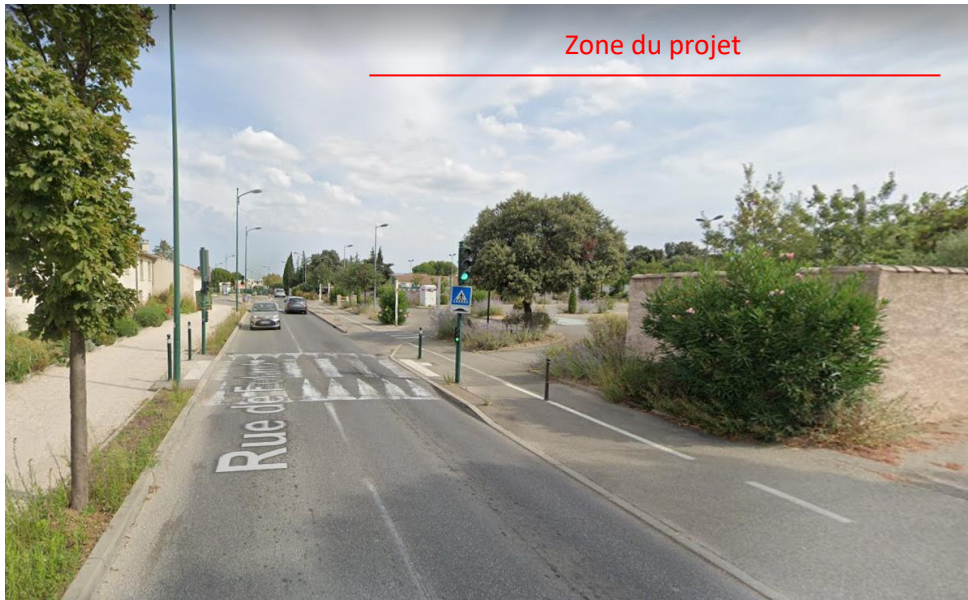
Vue 1 : Photographie depuis la rue de Folard en direction du Nord (Paysage lointain – Août 2019)