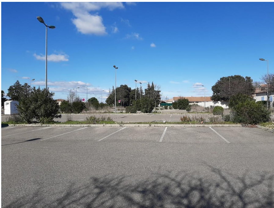
Vue 3 : Photographie depuis le sud de la zone de stationnement (environnement proche - Février 2020)