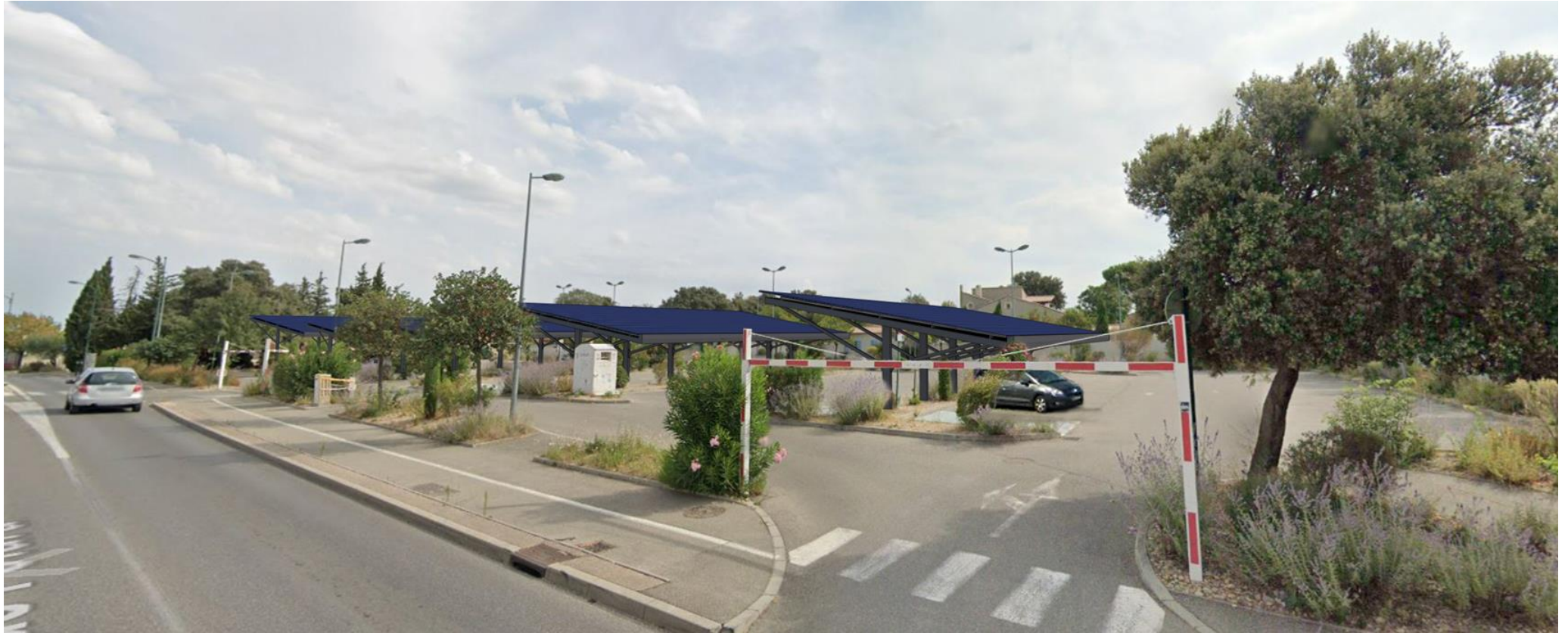
Insertion paysagère depuis la vue n°4 (environnement proche – Août 2019)