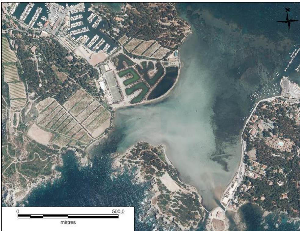
Localisation du site (2011)