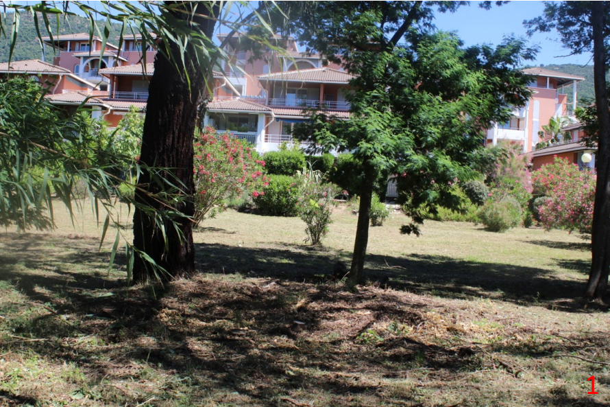
Vue proche – photos de Juin 2020