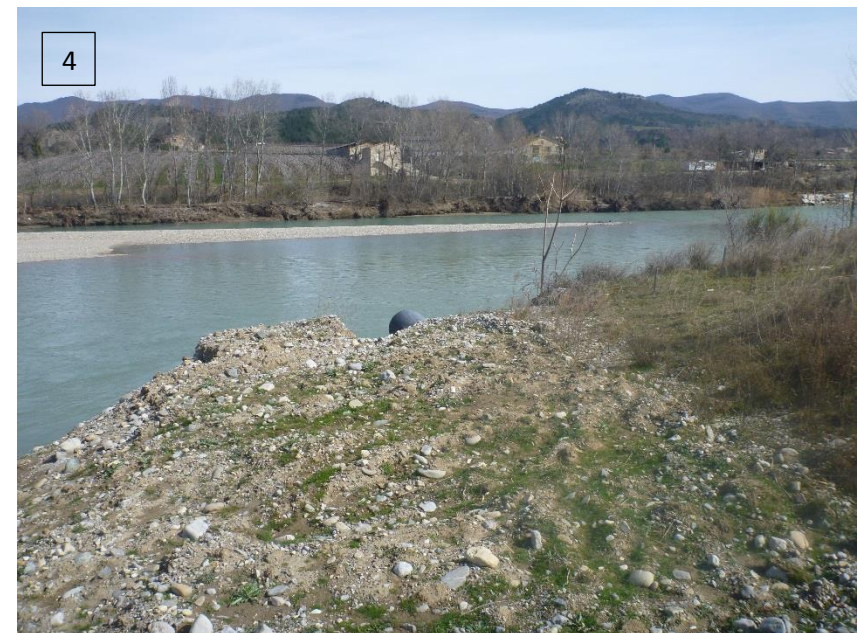
Figure 4 : Rejet canalisation SNCF dans la Durance et futur point de rejet des eaux de la Redonnette