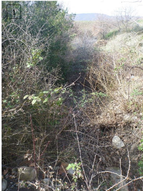
Figure 1 : Ravin de la Redonnette