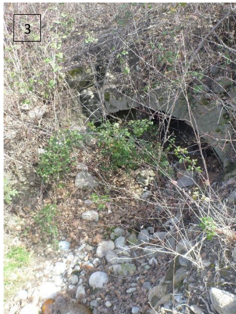
Figure 3 : Départ de la partie busée de la Redonnette