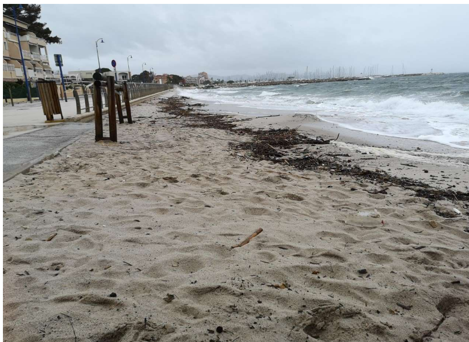
Prise de vue n°2 : 20 avril 2020

A noter : la photo est prise en moment de tempête, avec la houle haute sur la plage