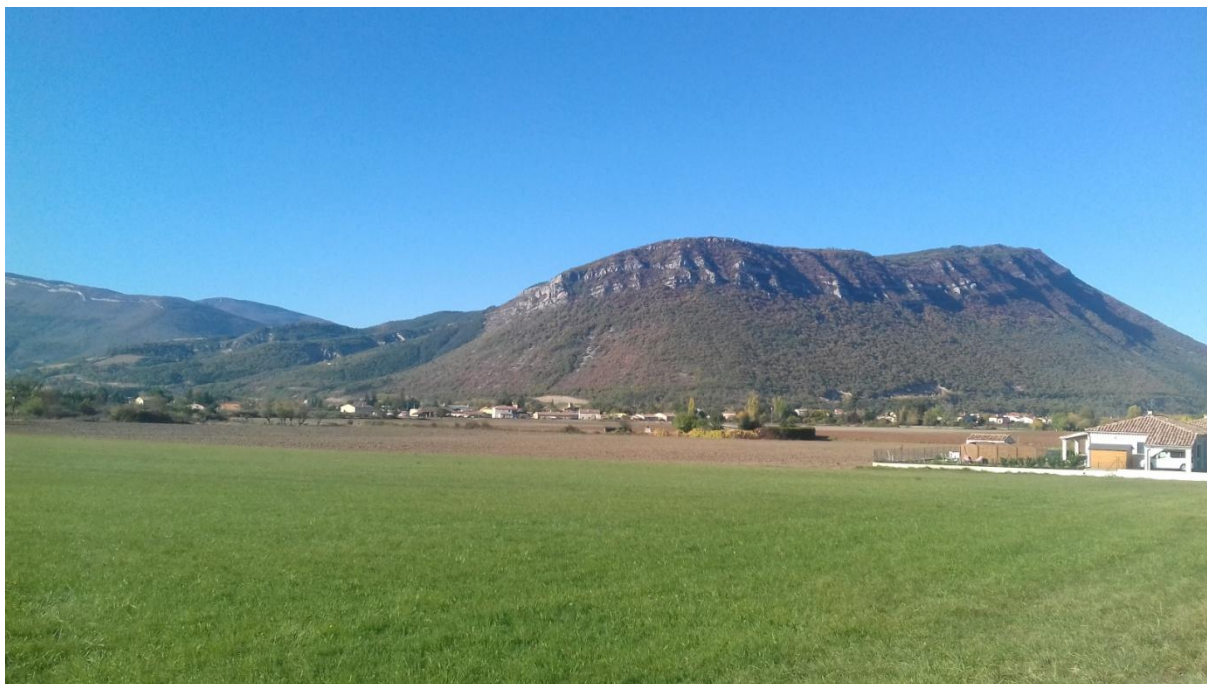
Figure 9 : vue sud ouest prise depuis la jonction entre la D22 et l'impasse menant au lieu-dit "la plan" (voie communale n°4).