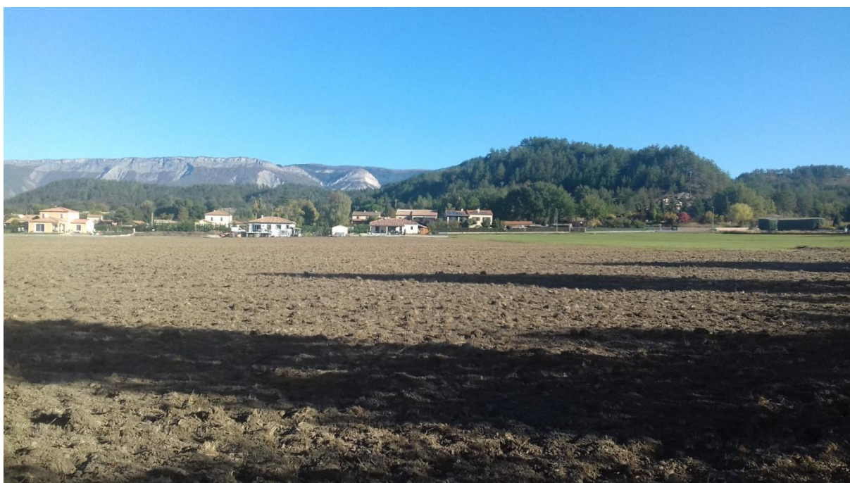
Figure 5 : vue nord est. On devine au fond la D22. A droite on note les parcelles cultivées 78, 128, 126.