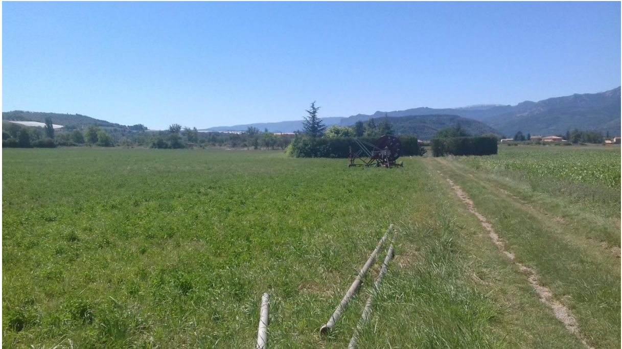
Figure 10 : vue sud depuis l'entrée du site. Derrière les haies, le cabanon d'été d'un ami de M Fournier. On note le chemin qui mène au cabanon. Ce chemin sépare en deux la parcelle I 1112 appartenant à M Fournier.