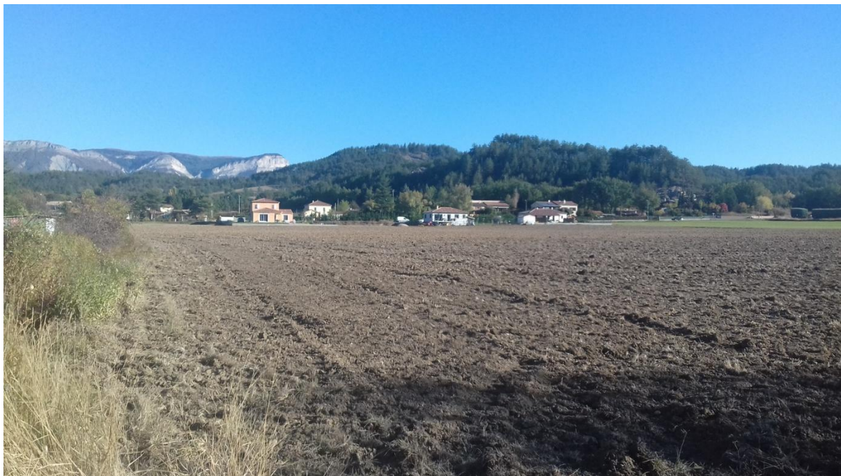
Figure 4 : vue nord. Au fond les 3 maisons construites il y a peu (on ne les retrouve pas sur les photos google). Derrière ces habitations, la D22.