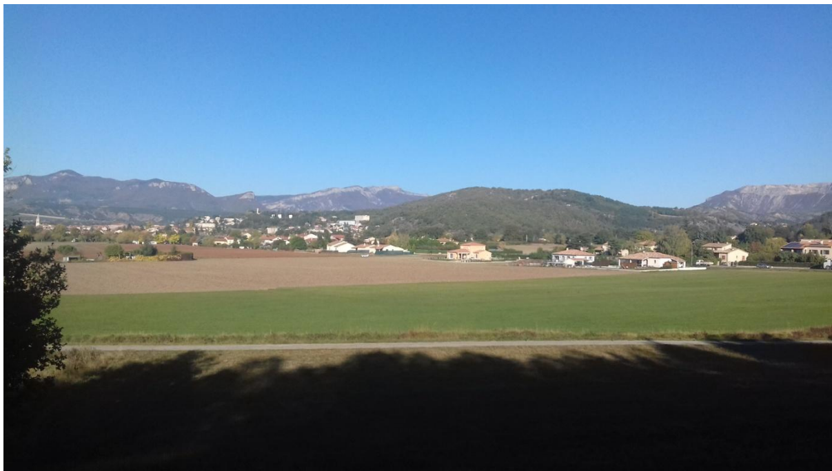
Figure 8 : vue ouest prise un peu en hauteur en bordure de bois depuis parcelle 341. On a une belle vue d'ensemble de la parcelle du projet. Au fond, Laragne.