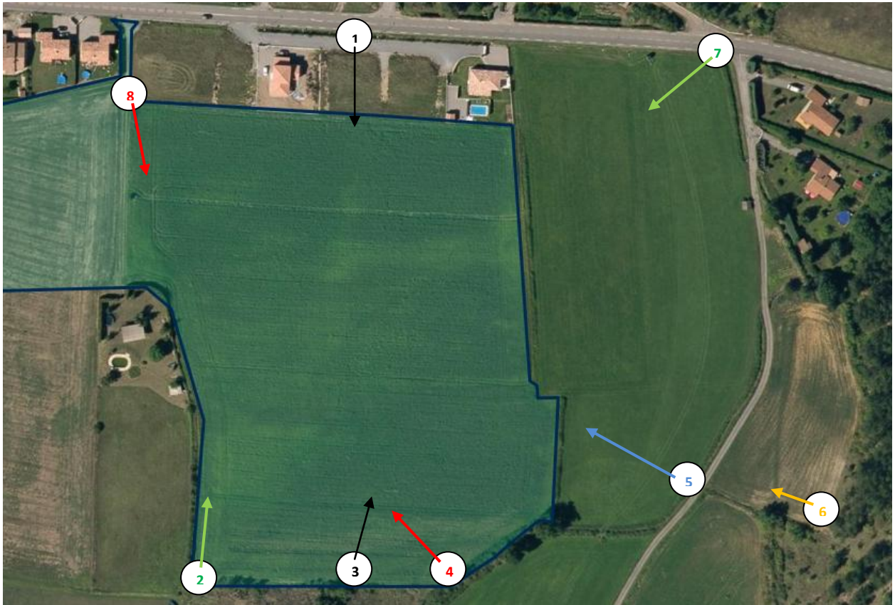
Figure 2 : Localisation des prises de vue Photos