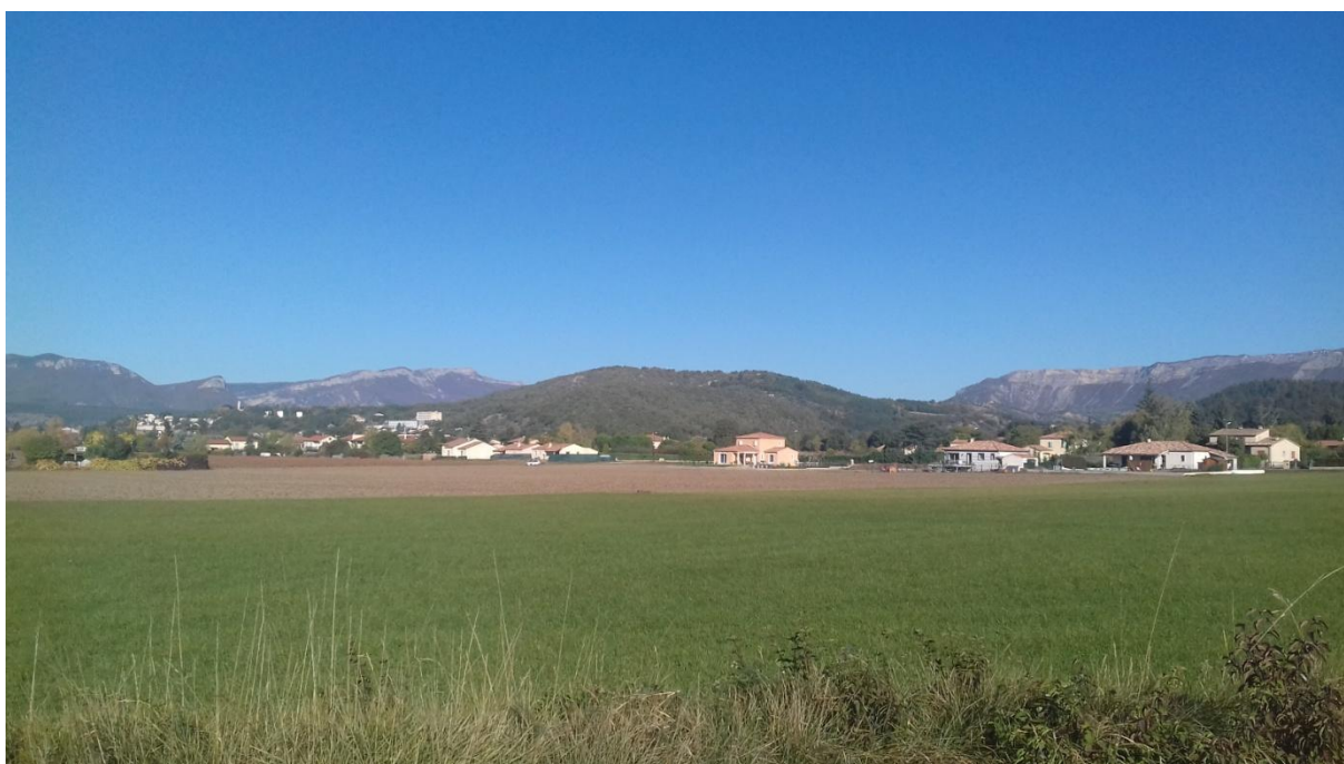
Figure 7 : vue ouest depuis l'impasse située à l'est et menant au lieu-dit "le plan" (voie communale n°4)