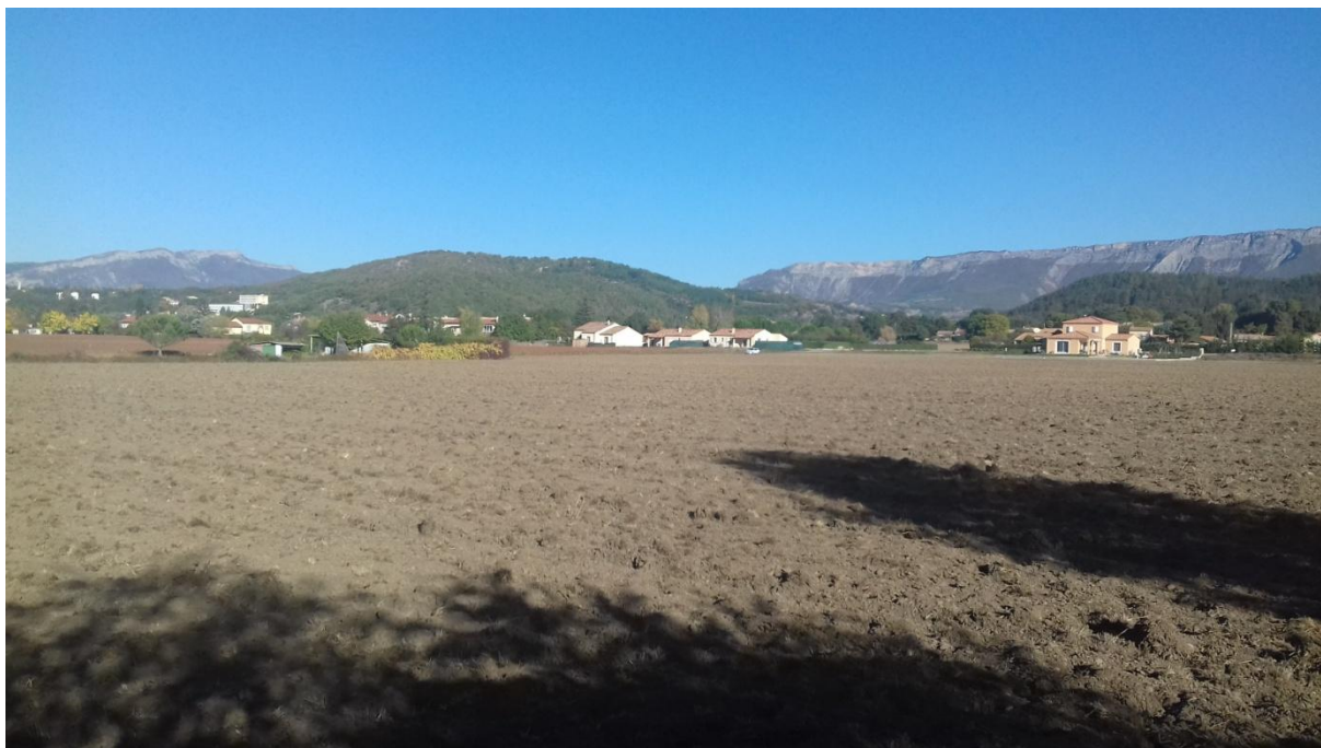
Figure 6 : vue nord ouest. On devine le cabanon en parcelle 123 qui n'est pas utilisé toute l'année mais simplement en été par un ami de M Fournier.