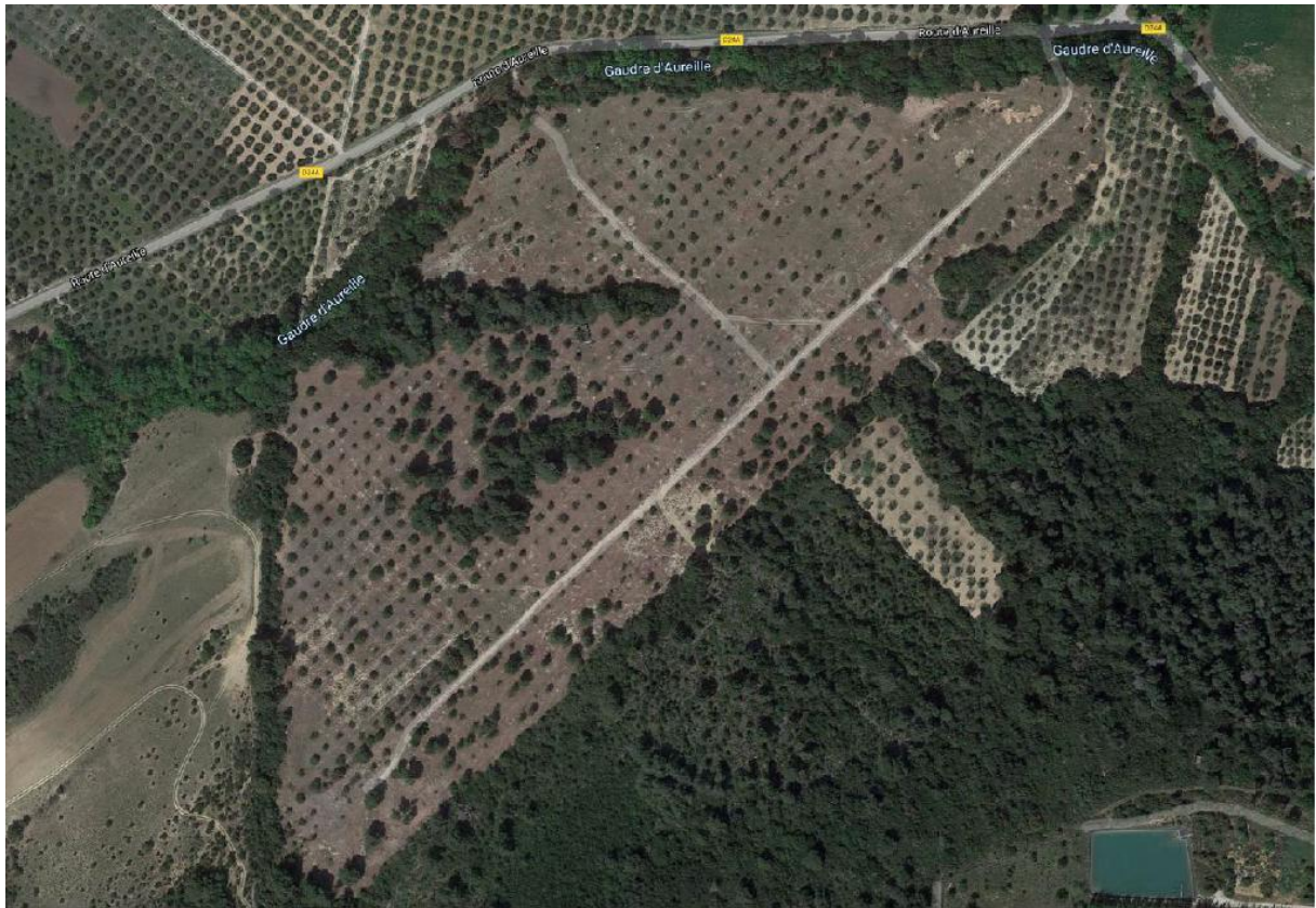
Photo aérienne du site du 20/05/2020