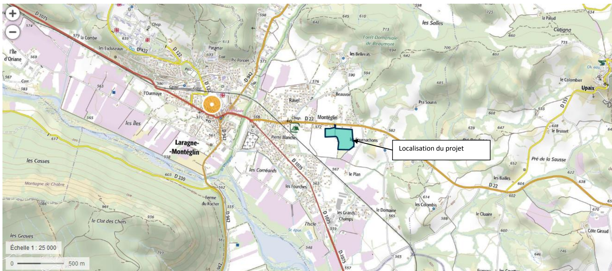
Figure 1 : Localisation du projet sur carte IGN au 1/25000

Lieu d'implantation de la serre photovoltaïque : Lieu-dit « Les Tatos» - 05300 Larnage-Montéglin