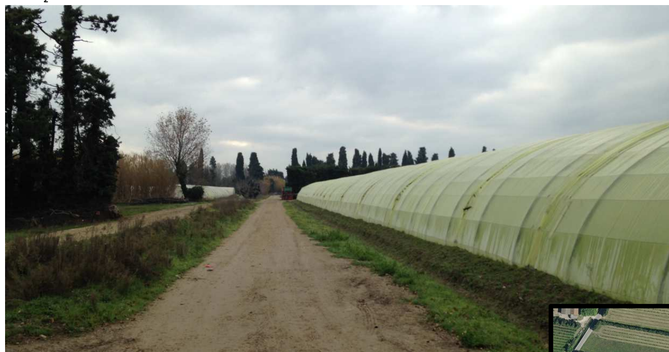
1. Frange Est de la Zone projet