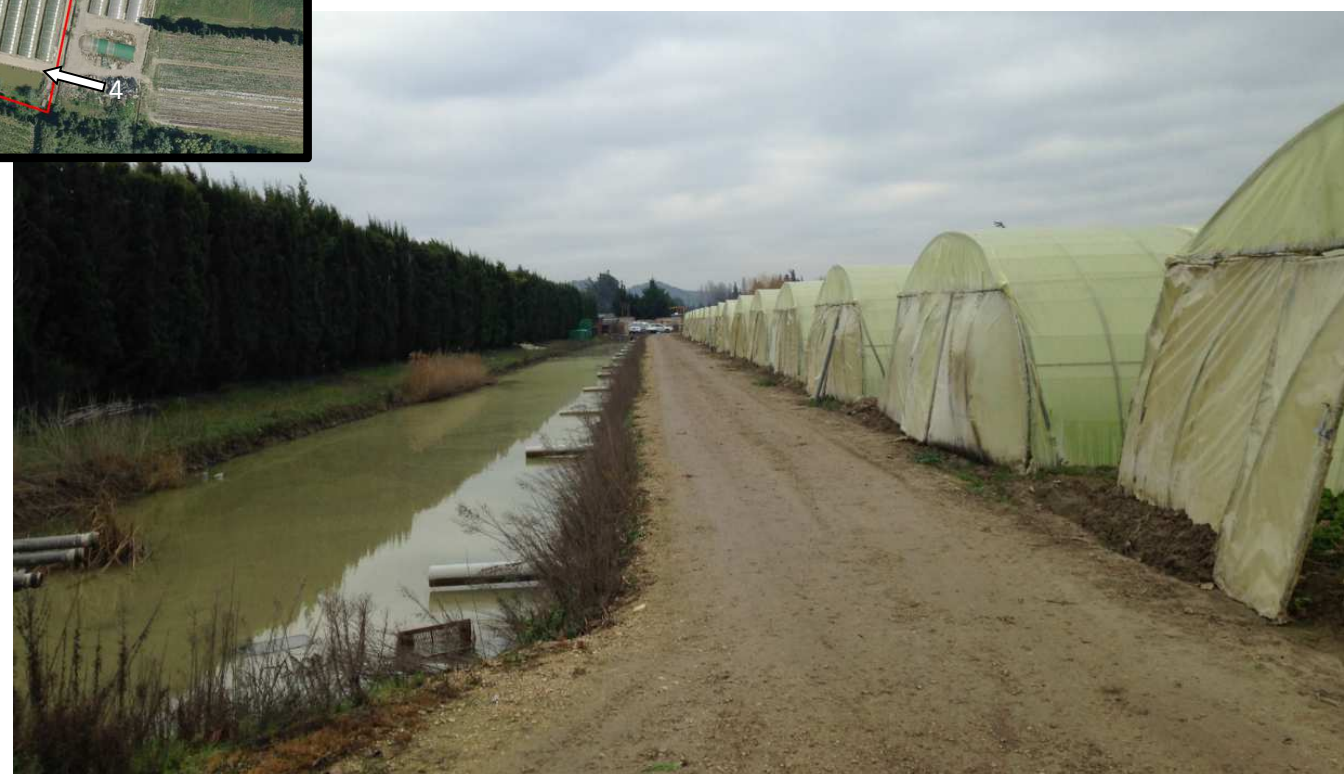
4.. Frange Sud du terrain