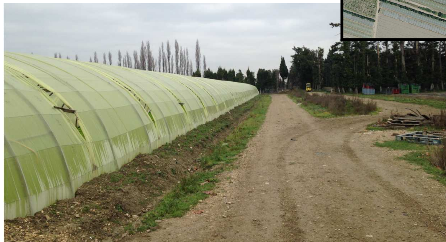
3. frange ouest de la zone projet